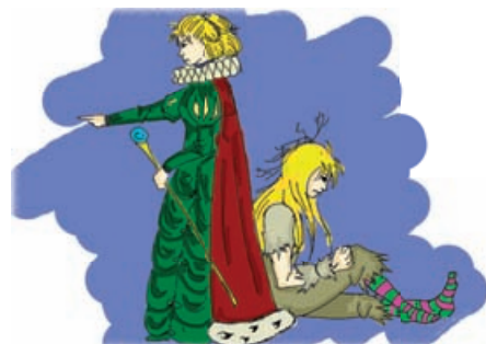
Выбор: Принцесса или Поросенок?

По какой-то неведомой причине почти вся женская часть нашего общества твердо убеждена, что во что бы то ни стало, всегда и во всех пьесах они должны играть принцесс. В крайнем случае – красивых девушек, в которых влюбляются красивые и героические персонажи. Или, наконец, кукол в красивых платьях. Уверенности в этом настолько непоколебима, что некоторые из них даже не задают вопроса «Я же буду принцессой, да?», считая это само