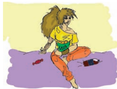
Чипсами фигуру не сберечь

Собственно говоря, понятно, что и эта затея не увенчалась успехом. Тогда мы решили, что спортчас придуман тоже не зря. И несмотря на то, что какие-то странные люди поставили спортчас сразу поле тихого часа, когда все насильно разгоняются по палатам (ну, кто насильно, а кто сам несетя в палату с воплем: «Кроватка, я люблю тебя!») и спят, а потом злобные, сонные, плетутся на плац. Некоторым личностям из нашей палаты, волею судьбы не принадлежащим к театральному отряду, удается неплохо побегать, попрыгать и поиграть в волейбол. Как ни странно, есть даже результаты, так что можете смело брать на заметку: спортчас — это веселый и эффективный способ следить за фигурой.