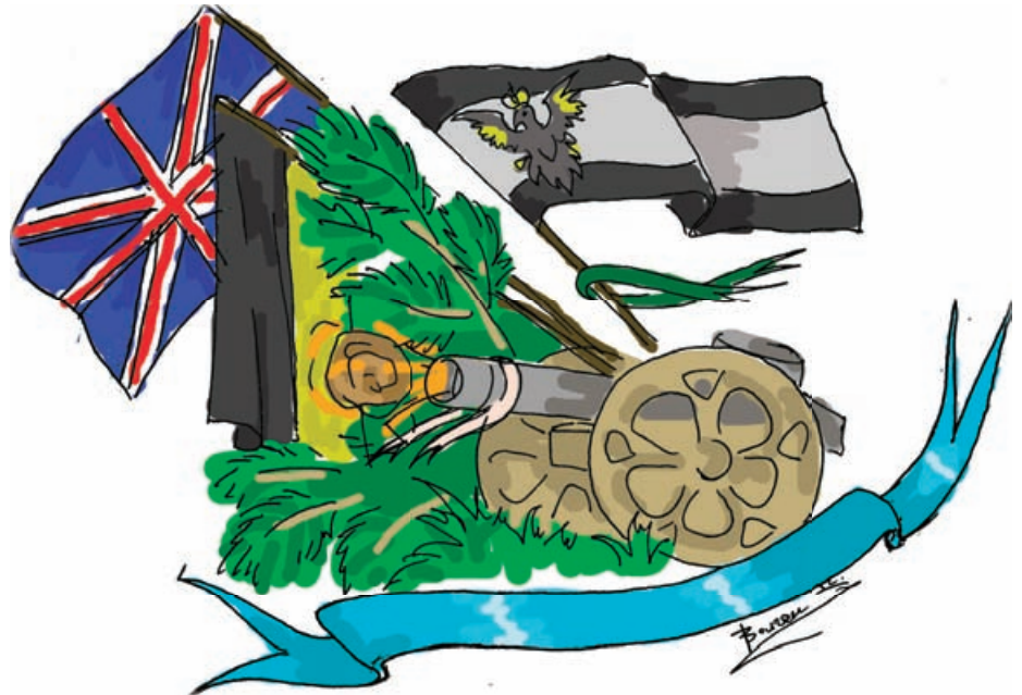
Вот так выглядит БРИГ в воспаленном сознании змеи Медянки

бавно щекотал мои легкие. Затем подносили огонь к этой крышечке, и у меня начиналась изжога, из-за которой все бумажки, находящиеся в моей трубе, мгновенно выходили наружу.