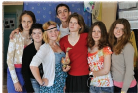
Позвольте представиться: МИМИКО