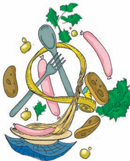
Вот так лапша превращается в жир

Но вот мы приехали, и потекла лагерная жизнь. И тут выясняется, что наш расчет на плохую еду оказался неверным: каждый день у нас то блинчики, то тортики, то макароны с сосисками... И в добавке никому не отказывают. А что уж говорить про шоколадки и печенье, которые съедаются в палатах после отбоя за занимательной беседой о соседках и мальчиках-комиссарах! Я вот тоже собиралась следить за фигурой и рассчитывать, опираясь на свой богатый, прямо скажем, опыт выживания в лагерях, от «мажорных» и «пафосных» Инглишклубов до новороссийской «Искры» с тараканами