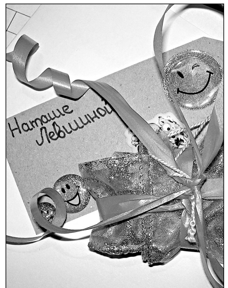
По ярлычку почтальон легко мог найти адресата и передать подарок.