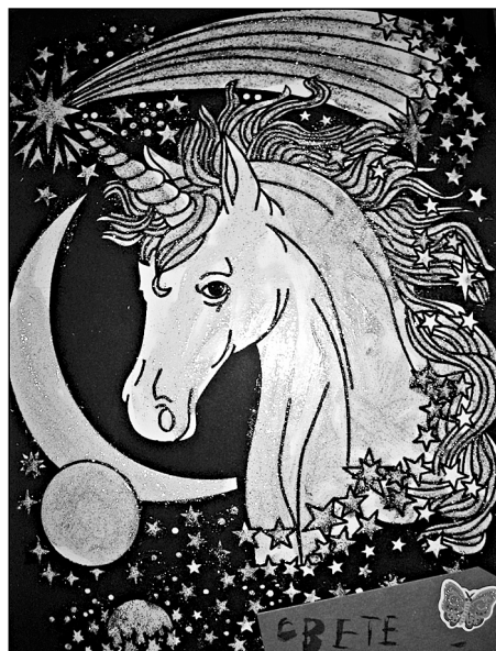
Белая лошадь на черном бархате была раскрашена блестящими красками.