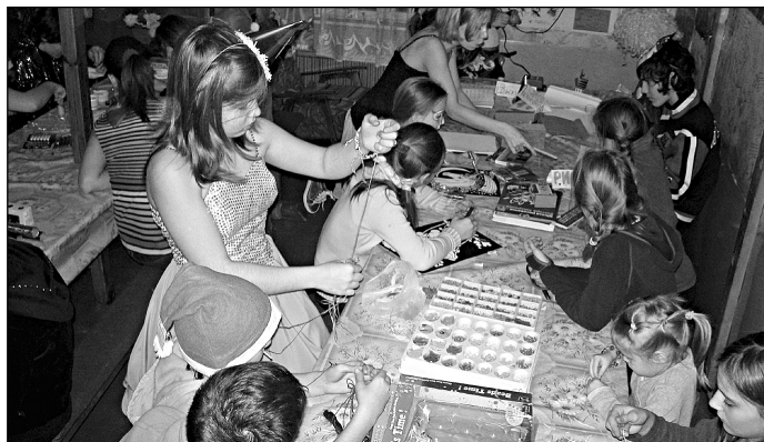
Период изготовления только начался, а работа уже кипит. У всех в голове зреет проект будущего шедевра.