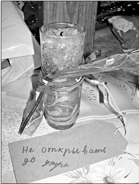
Свечи всегда были популярным подарком. Сегодня их можно было сделать самим.