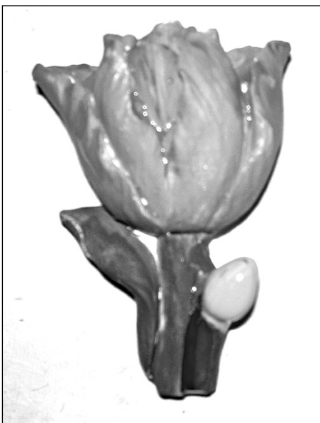
Роза – символ любви, даже если она из гипса и раскрашена гуашью.