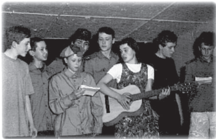
Первый ролевой отряд Zero, архив 1998 года