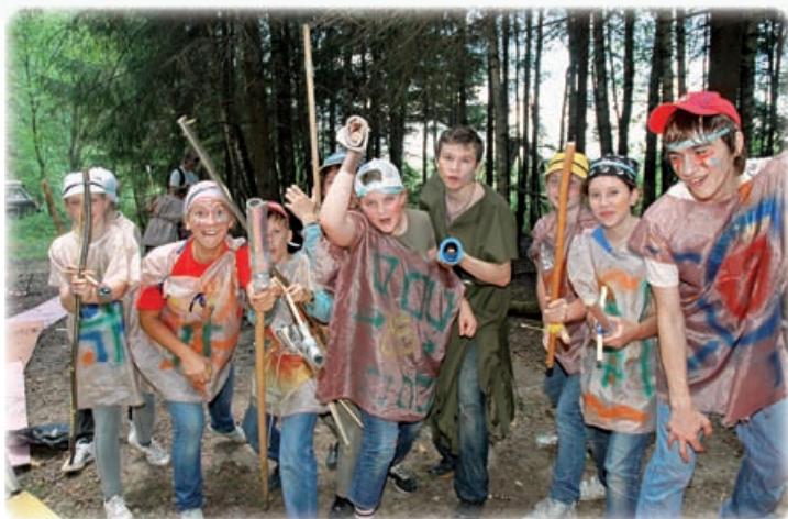
Яркие костюмы, удобное оружие — и БРИГ готов!

Инструктор ролевого отряда — о прошедшей ролевой игре