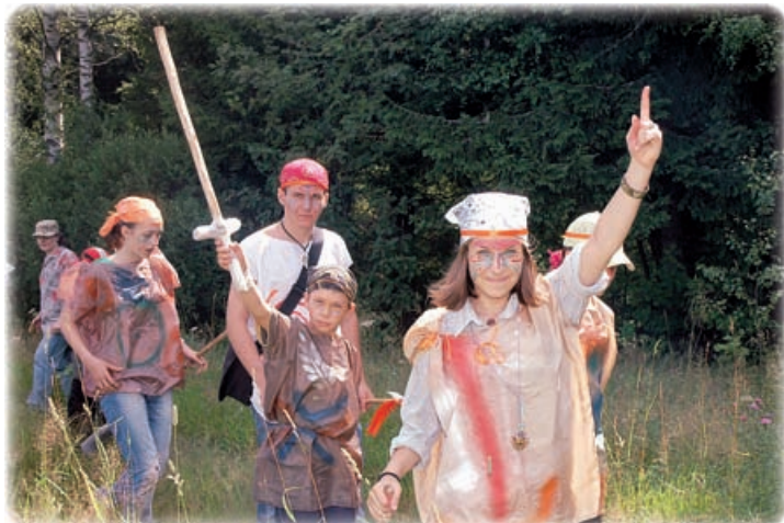
Племя кошачьи — победители

Бриг прошел, фух. И как-то сразу не привыч- но, что уже прошел. Тут делали его неделями, а он бац! — и прошел. И как-то и не привычно сразу, без него то. Зато можно не- кие выводы сделать. И по атмосфере игры, и по но- виночкам, и по еще много чему. Я думаю, что БРИГ прошел хорошо, но. Но. Но, только представьте себе, насколько он бы луч- ше прошел, будь на ули- це, скажем, +20 градусов, хороший приятный про- хладный ветерок. К мое- му большому сожалению, погода зависит не от нас. Ладно, будем надеяться, что хоть на Зарнице пого- да будет не такая жаркая. А вы заходите в бункер, сделаем еще один БРИГ. Про запас, так сказать.