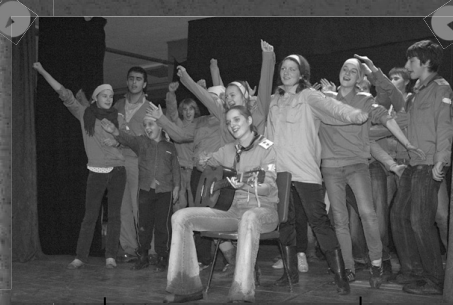
Показ КТД взвода Восток