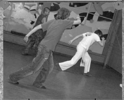
Южное искусство борьбы — капозйра