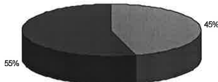
Правильно ли были расставлены свечки?