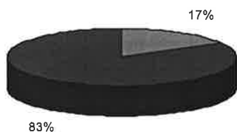
Как должны были быть расставлены свечки?