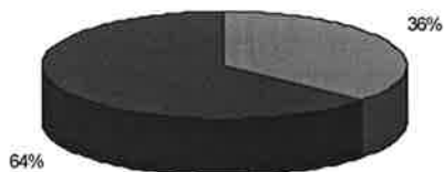
Понравилась ли дискотека?