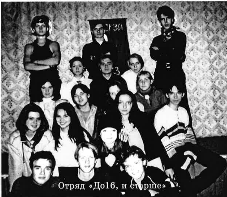
Отряд «До16, и старше»

Через год-полтора остатки нынешнего «до 16-ти» волюются в Комиссар, но ему на смену обязательно придет кто-то еще. Почему я так уверен в этом, да потому, что это еще одна