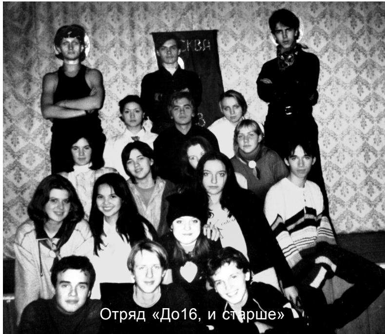
Отряд «До16, и старше»

Через год-полтора остатки нынешнего «до 16-ти» вольются в Комиссар, но ему на смену обязательно придет кто-то еще. Почему я так уверен в этом, да потому,