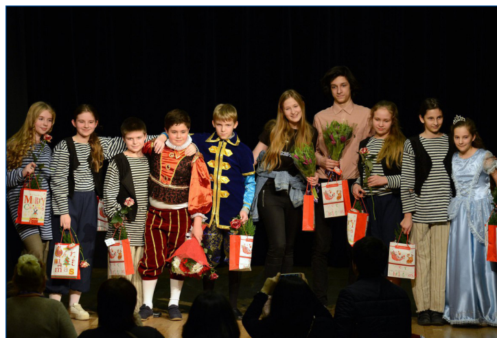
Труппа спектакля «Здравствуй, принцесса»

Удачно подобранная пьеса позволила раскрыть для зрителей почти каждого, а раскрывать есть что! У этого коллектива, несомненно, большой потенциал в театральной деятельности, впечатляет «косяк» девочек, которые явно готовы работать вместе, проявлять себя, учиться и расти творчески. Мальчикам зато есть куда стремиться. При всем этом ощущалась какая-то «сырость», недоработанность в деталях, например, в переходах между сценами или во взаимодействии всех персонажей в целом. Но, что же, это лишь «проба пера», уверена, что об этих ребятах напишут еще много-много раз!