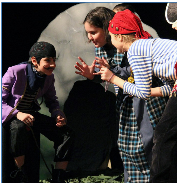
Разбойники строят козни против Айболита