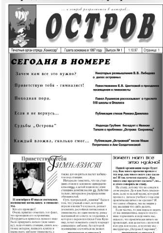
Первая обложка «Острова»

Все предыдущие номера можно прочесть на сайте http://vostrove.ru/paper