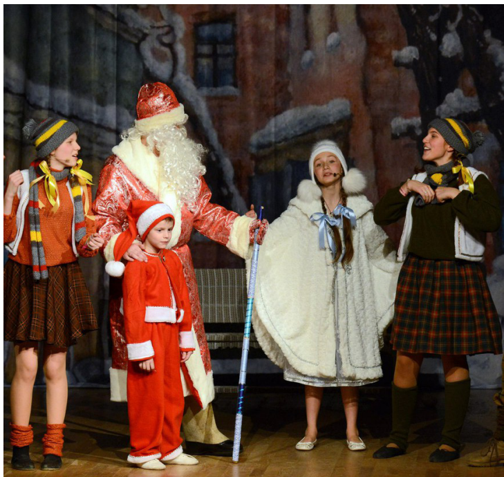
Герои «Снежной сказки» на сцене

Кажется, что к своему «выпускному спектаклю» семиклассники подошли с большим опытом качественной работы, правильным отношением и сплоченным коллективом, готовым к большим вызовам — теперь уже в серьезных Островских спектаклях.