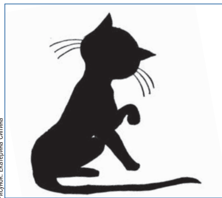
Рисовок: Екатерина Сипина

лодки появился незнакомый черный кот. Дальнейшее произошло так неожиданно и молниеносно, что Кот даже усомнился в том, не померещилось ли ему это. Из темной улочки вылетел мотоцикл, резко затормозил, и из него выскочили двое – один маленький, в кепке, другой – высокий. Они схватили незнакомую кошку, стукнули пару раз и засунули в мешок. Несчастный отчаянно мяукал и вырывался – но все без толку. Бандиты кинули мешок с котом в мотоцикл, сами запрыгнули туда, и – только их и видели!