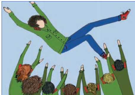
Рисунок: Алена Сафронова

В этом году я участвовала в зарнице в первый раз. Прежде я уже слышала про неё и думала, что это очень сложно, страшно и больше подходит мальчикам или старшим ребятам, так что не считала, что мне стоит идти на это мероприятие. Но я поговорила с ребятами, которые уже много раз играли, они меня убедили, и я решила попробовать. На объяснении правил всё казалось очень сложным. Расстроило то, что я была единственной девочкой из пятых классов, которая пришла на зарницу. В первое время всё казалось невыполнимым, запутанным и