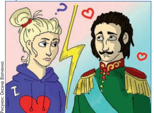
Рисунок: Оксана Волченко

(Авторская орфография и пунктуация сохранены.)