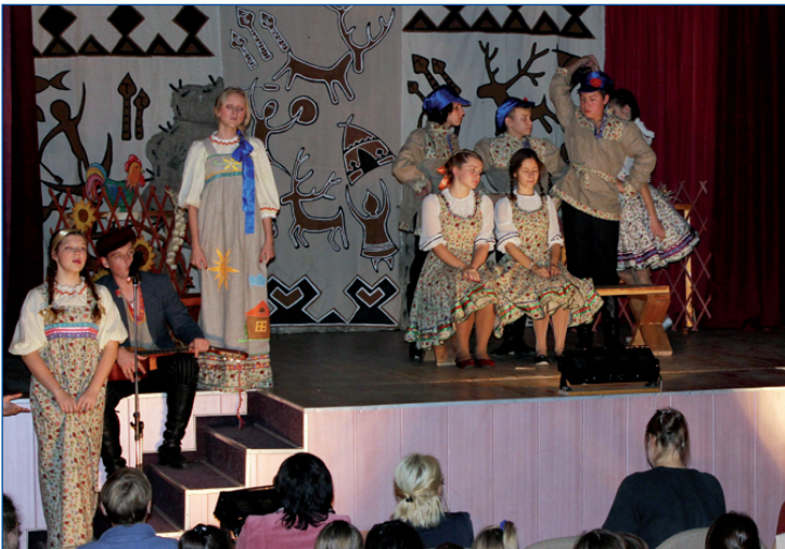
Фото школы № 8 г. Когалыма

За, казалось бы, короткий фестиваль (он длился всего навсего три дня) мы очень привязались друг к другу и, теперь все с нетерпением ждут следующей встречи, следующего спектакля, следующего «Медвежьего угла».