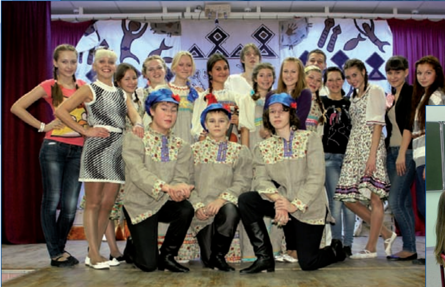
Фото школы № 8 г. Когальма