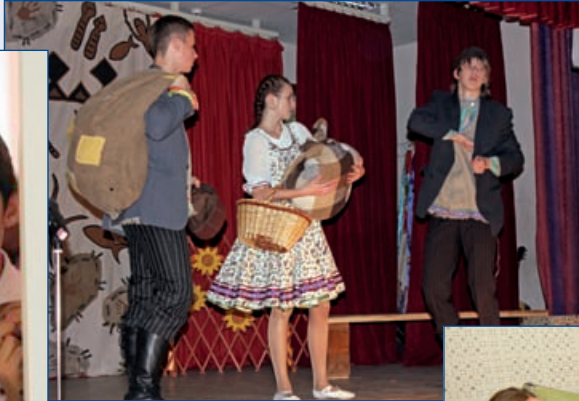
Фото школы № 8 г. Когальма