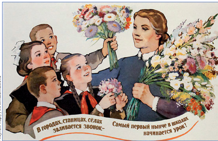
Дарить подарки учителям — добрая традиция

Конечно, когда речь идет о коллективном подарке, в большинстве случаев всем