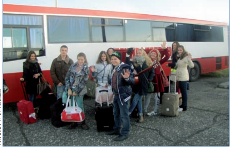
Фото школы № 8 г. Когалыма

Организаторы фестиваля оказали нашей делегации невероятно радушный прием. Кто-то из учеников или учителей школы №8 всегда сопровождал нас в прогулках по городу. Программа была очень насыщенной и интересной. Каждый день нам предлагали поучаствовать в новом мероприятии: в походе на каток с когалымскими ребятами, соревнованиях по