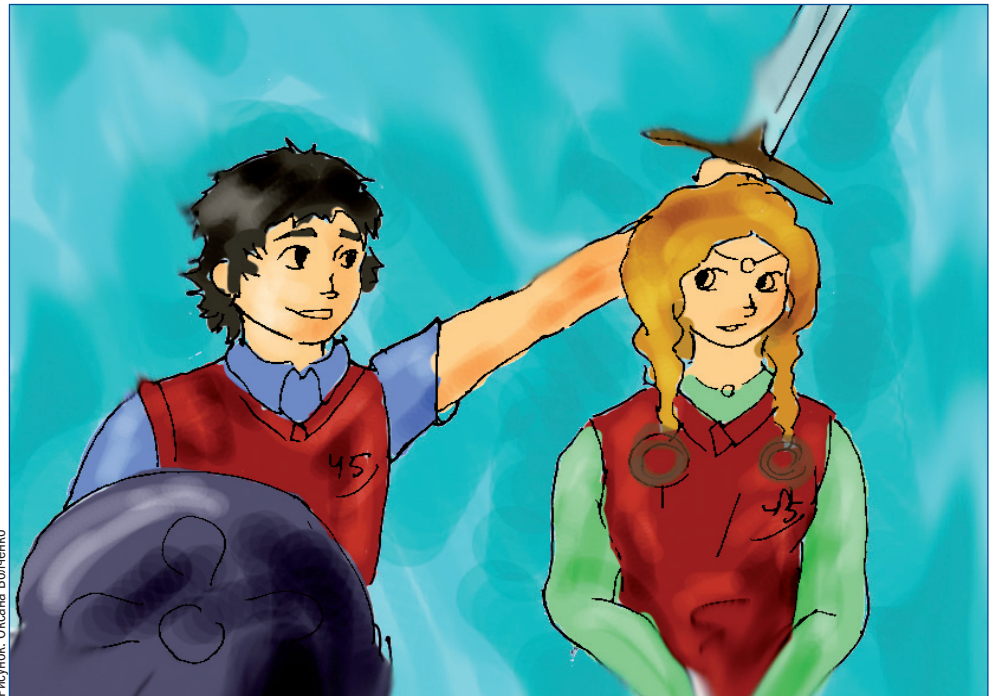
Рисунок: Оксана Волченко