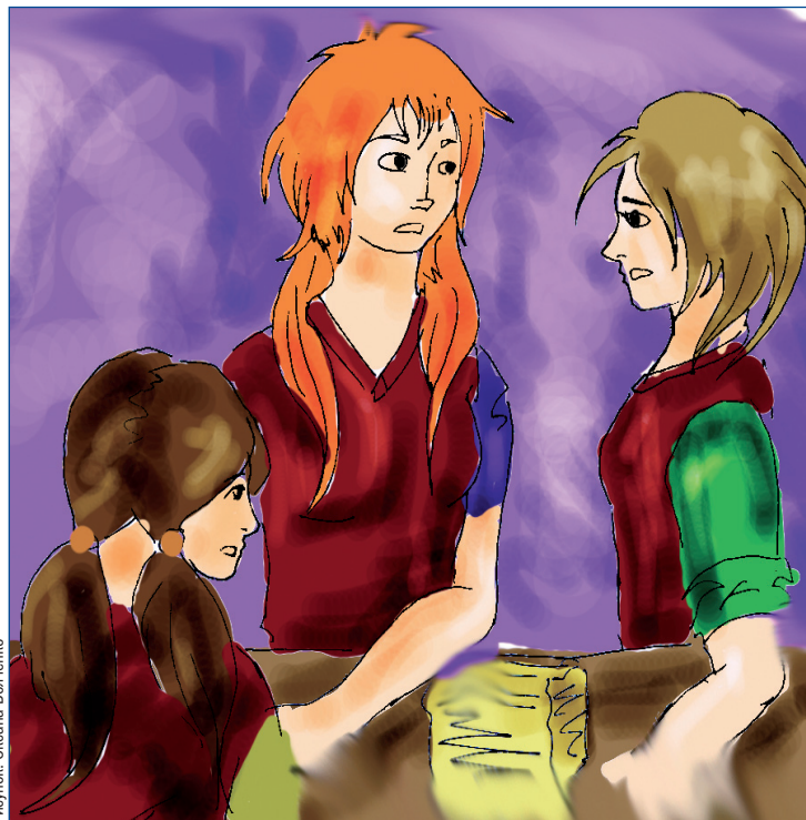
Рисунок: Оксана Волченко