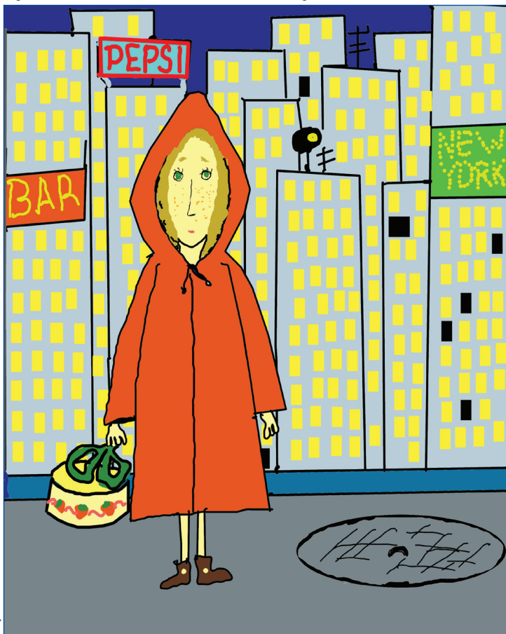
Рисунок: Полина Бычкова

Эта книжка произвела на меня большое впечатление. Она существенно выделяется среди остальных современных произведений тем, что в ней о жизни героев повествуется не как о судьбе единственных и неповторимых личностей, в сущности, ничем не отличившихся, а наоборот, говорится о персонажах, как о частностях, об очень мелких точечках, передвигающихся в огромном пространстве, несмотря на то, что описываются, казалось бы, очень яркие и необычные характеры. Возможно, такое впечатление складывается из-за того, что место действия — Нью-Йорк, огромный, разнообразный, вмещающий в себя миллионы абсолютно разношерстных людей. Этот город — действительно город свободы, но парадокс в том, что при этом большинство живущих в нем людей так же зажаты и ограничены, как и повсюду. И только неудержимый полет фантазии, детская пылкость и интерес к жизни, к окружающим людям и миру, способны спасти от рутинности и однообразия разнообразия гигантского города. Только преодолев его тогда ты сможешь достигнуть величия Статуи Свободы. Прочитайте, и вы не пожалеете! Миранфу.