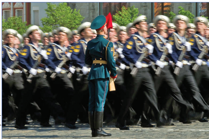
Пожалуй, самый масштабный парад – 9 мая 2010 года