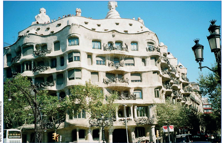
Каса Мила – жилой дом, где нет ни одного угла

творца. Саграда Фамилия (Собор Святого Семейства) – его дитя, строительство которого должно закончиться к 2030 году. Собор поражает, удивляет, заставляет задуматься, переосмыслить и снова вернуться. Там есть на что посмотреть: витиева-