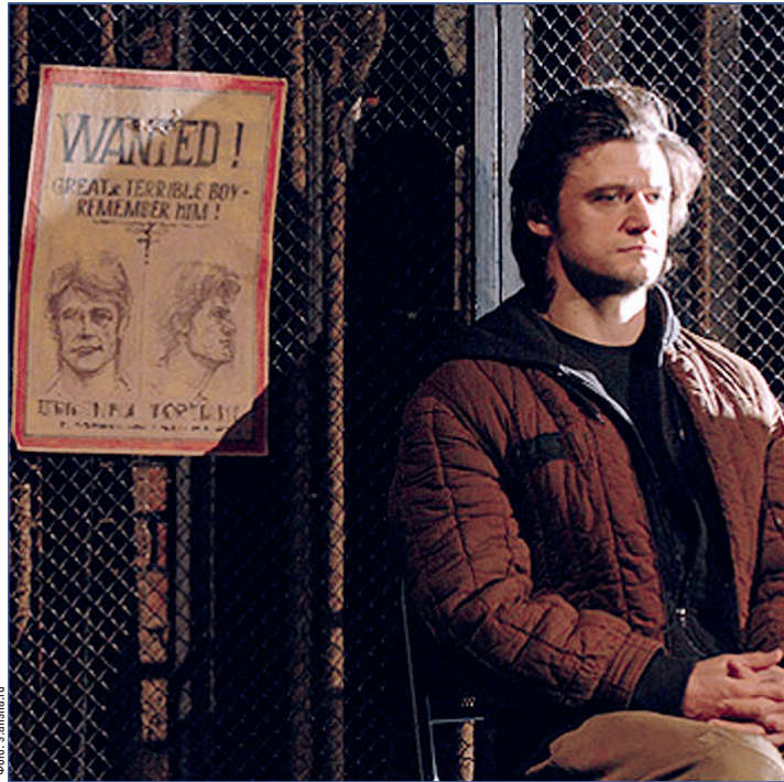
Главный герой на фоне собственного портрета

На протяжении спектакля тебя каждую минуту как будто берут за воротник, открывают