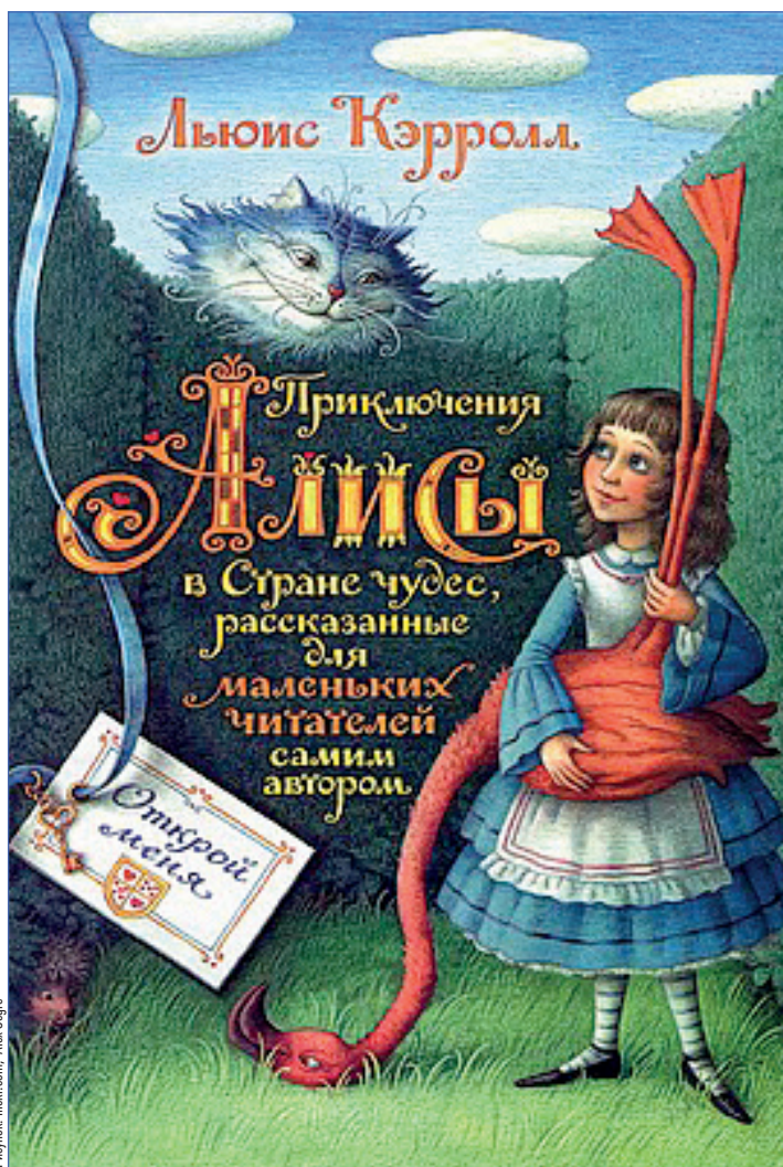
Почти все хотя бы раз держали в руках эту книгу

И так далее, и тому подобное. А еще – парадоксы, головоломки с печеньями, одинокий гинкго билоба, обезьяны профессора Добени, горгульи и план лабиринта, который можно вытоптать на свежем снегу. Так проводила свое свободное время Алиса, про которую и написал лучшую, самую чудесную в мире сказку Льюис Кэрролл, он же Чарльз Лютвидж Доджсон. Чем дальше, тем страньше!