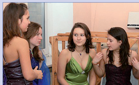
Бал ко дню Святого Валентина