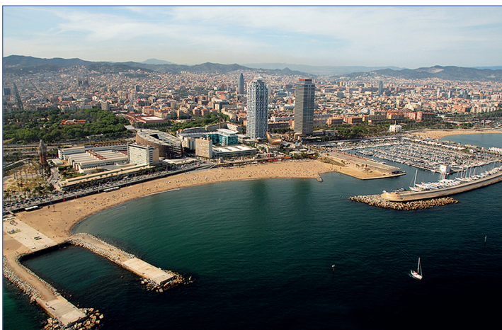
Барселона с высоты птичьего полета

Барселона – это бешеная струя жизни, проделавшая долгий путь по морю и осевшая в столице Каталонии; это тот воздух, который мчится из квартала в квартал, пробивая преграды, невзирая на стены, заставляя сердце каждого, кто идет по ее улицам, биться чаще.