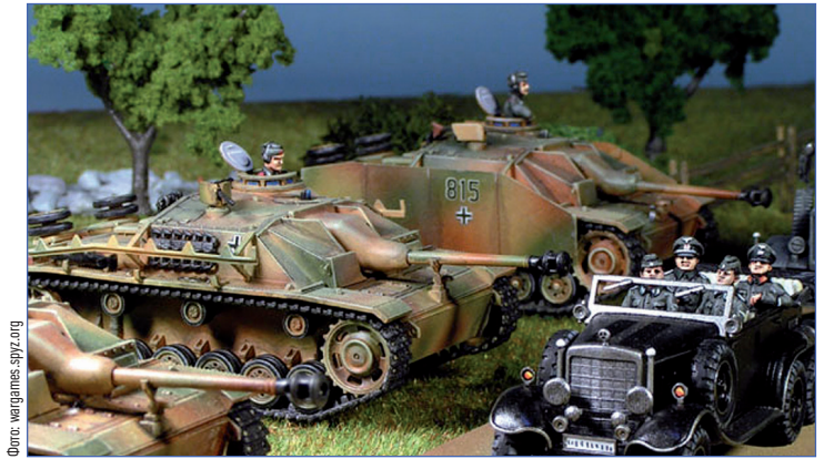
Вид военных действий вблизи

Правила быстро распространились по всему варгеймерскому миру, став образцом для правил на допороховую эпоху. WRG продолжила выпускать правила уже на другие периоды, и все эти правила получили такую же популярность.