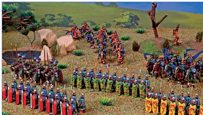
Маленькие фигурки, масштабная игра

Начните с чего-то простого, по чему можно получить ясный ответ на свои вопросы, например, с прекрасных правил DBA, о которых столько написано в сети. Затем можно перейти на что-то более сложное. Главное – полагаться на себя.