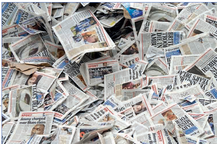
Газеты, в общем – макулатура

Новый вирус – это прекрасно! Антибиотиков против него нет, диагностического оборудования нет, вакцин нет. Давайте деньги!