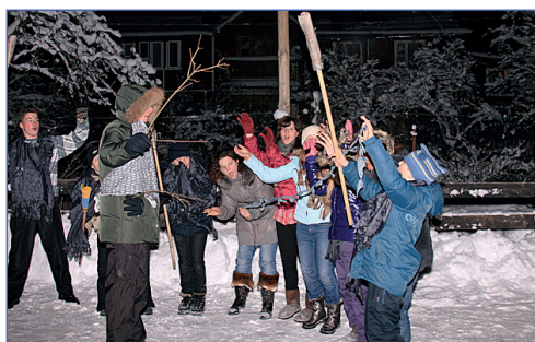
Давайте говорить с деревом...

В искусстве, как на войне: побеждает сильнейший. Вот и на Дне современного искусства каждый новоявленный творец всеми силами старался показать только лучшие стороны своего детища, и каждый со своей задачей справился.