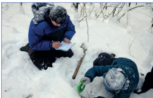
Где то в снегу зарыт клад...