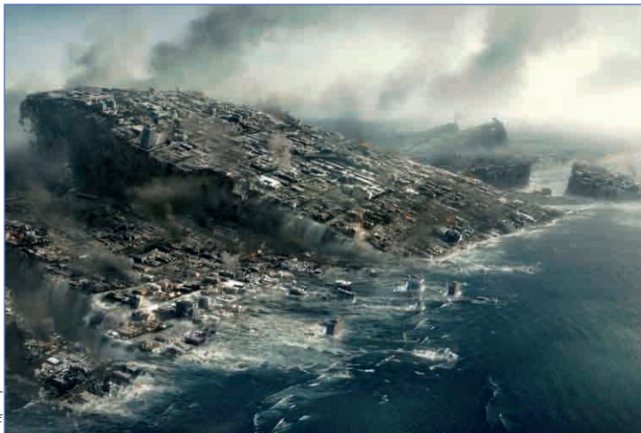
Кадр из фильма «2012»

«Арктические льды тают. Уровень мирового океана растет. Человечество в панике убегает из прибрежных зон. Оставлены такие города, как Лондон, Санкт-Петербург, Марсель...» Это стандартный прогноз на ближайшее будущее. Причины, по которым этого не случится, понятны школьнику. Крупнейшие ледяные шапки планеты – Антарктида, Северный Ледовитый океан и Гренландия. Вы в чай кладете лед, чтобы он немного остыл? Я кладу, и я не мог не заметить, что, когда лед в чашке тает, уровень чая не поднимается, хоть убей. Есть даже такая задачка по физике в 10 классе. Ответ в ней такой: плотность льда составляет 90% от плотности воды, и лед торчит из воды ровно на 10%. А значит, когда весь лед Северного ледовитого океана растает, уровень Мирового не вырастет ни на миллиметр. Правда, остался еще лед, который лежит на суше, 90% которого находится на Антарктиде и 9% – на Гренландии. А они вообще могут растаять? По данным ООН (там есть и научный отдел), температура возрастет максимум на 5–6 градусов. Среднелетняя температура в Гренландии и Антарктиде примерно 15 °С. По самым ката-