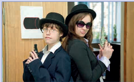
Ролевая игра Пространства