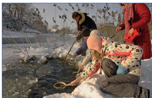
И даже холод не помеха

Представление отряда в первый день – дело серьёзное. Ведь, как лодку назовешь, так она и поплывет. Лодку, которую вы видите на фотографии назвали «ЧУ-ЩУ». Очевидно, плывет она вполне под стать названию – чудно и «щустро».