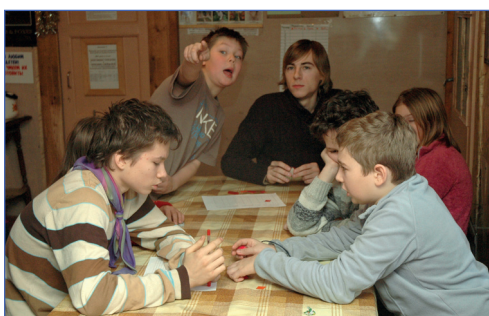
Быстрее повышаем питательность!

Традиционно череду тематических дней лагеря завершала экологическая ролевая игра. В этом году за основу была взята модель прошлого эколагеря. Каждая из групп – это определенная популяция животных, которая борется за выживание.