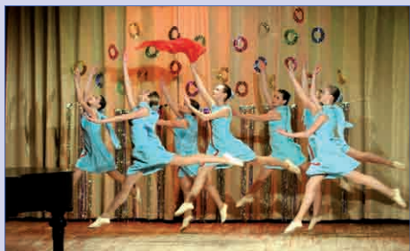
Волшебный мир танца

Газета основана в 1997 году Печатный орган детской организации «Остров Сокровищ» Гимназия № 45