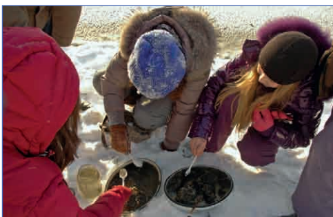
Там что то шевелится!

«Экосистема» расположена практически на территории заповедника. Именно поэтому там можно наблюдать огромное количество невиданных нами живых существ. И не только увидеть! Некоторых можно потрогать и даже посмотреть, что у них внутри.