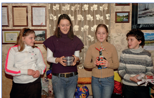
Последнее достижение искусства

В искусстве, как на войне: побеждает сильнейший. Вот и на Дне современного искусства каждый новоявленный творец всеми силами старался показать только лучшие стороны своего детища, и каждый со своей задачей справился.