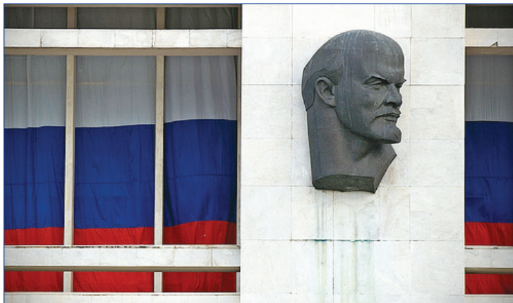
Новый флаг повесили, пока Ленин отвернулся

Мне кажется, что избежать финансового кризиса в Ульяновске можно очень простым способом – надо просто перевезти туда мавзолей Ленина. Это, скорее всего, вызовет рост оптимизма, резко улучшит кармы и экономический рост.