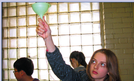
Конкурс фонтанов – 30 апреля