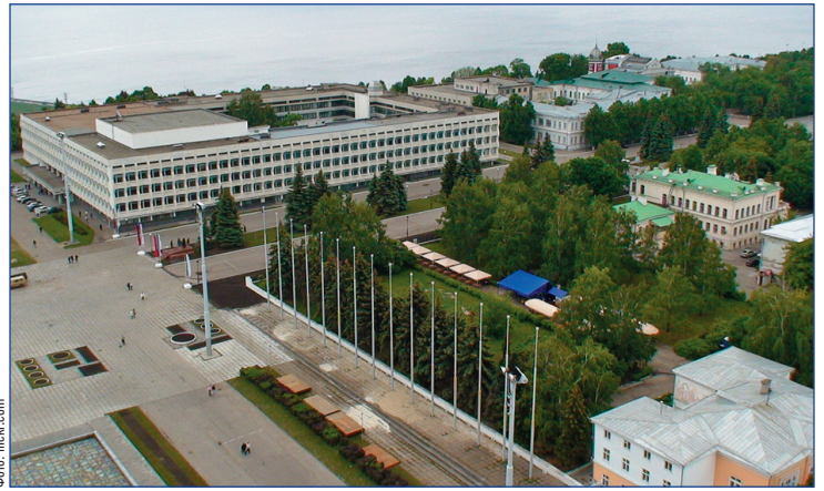
Вид с высоты гостиницы «Венец»

Кроме того, не могла не сохраниться гимназия, в которой учился тот, кто завещал всем учиться три раза подряд. Правда, сама гимназия в 1970 году переехала в новое здание, а в старом сделали музей. Рядом с гимназией стоит бюстик Пушкина – дар вели-