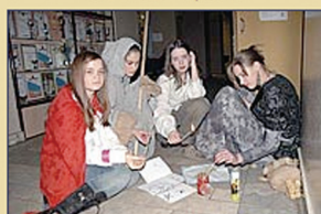
Персонажи плетут заговор