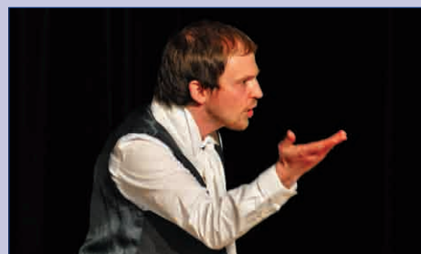
Спектакль «Горе от ума» 3 ▶

Газета основана в 1997 году Печатный орган детской организации «Остров Сокровищ» Гимназия № 45