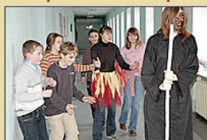
Охота на "черного"