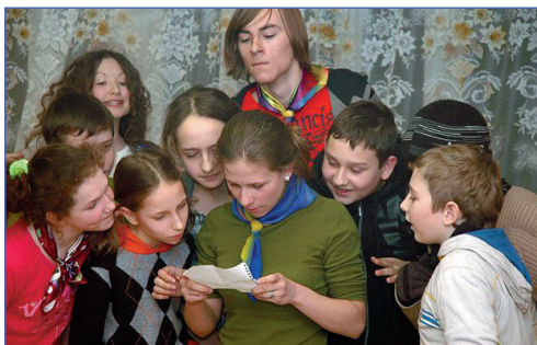
Представление «Крокодила в подарок»

Как многие уже знают, недавно прошел весенний сбор-2009. И это совсем не случайно, что многие знают. Так как эти многие там были и рассказали о нем всем тем, кто не поехал. Сбор удался на все триста процентов, это уж несомненно. Два тематических дня: «Волшебника изумрудного города» и паранормальных явлений; ролевая игра, которая в этот раз была по книжке Роберта Шекли «Цивилизация статуса»; обновившийся состав организаторов и многое другое было этой весной на сборе в ДОЛ «Энергия» – месте, в котором мы проводили сборы уже не раз и которое успели полюбить. Никто из нас не пожалел, что поехали. А вот пожалел ли ты, что не был там? Если ты еще сомневаешься, то вот несколько доказательств того, что так было невероятно хорошо и интересно. Мы все надеемся, что в следующий раз нас будет еще больше и нам вместе с вами будет еще веселее.