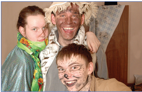
Они не такие страшные как кажутся

Не волнуйтесь, с ними все в порядке. Тот, что по середине, он просто играет снежного человека. Тот, что справа, оброс немного шерстью, нашел какие-то лохмотья, повыл чуть-чуть на луну и собрался играть оборотня. Команда организаторов готовилась пугать.