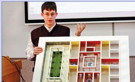
Защита персональных проектов