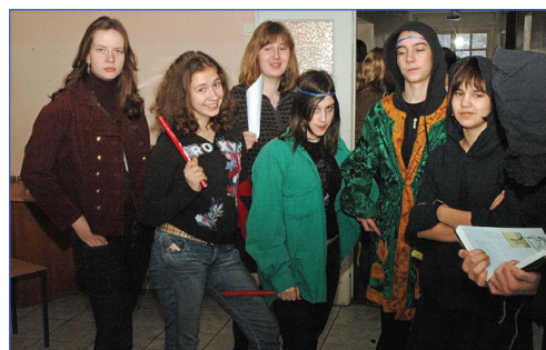
Пока еще добрые

Возведение памятников в честь погибших персонажей, которые погибли из-за того, что выпили томатный сок с сахаром, солью и перцем. Но оно того стоило, так как просто невозможно было не восхититься снежным памятником самому себе «погибшему».