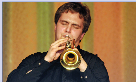
Концерт «Мы из Джаза»

Газета основана в 1997 году Печатный орган детской организации «Остров Сокровищ» Гимназия № 45