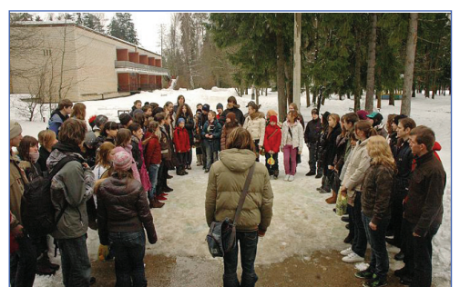
Споем на прощанье?

Вот и подошел к концу весенний сбор. Несмотря на сугробы снега и холод, нам удалось сохранить теплое настроение на протяжении всего сбора. Время отъезда – самое грустное, но ведь мы совсем скоро приедем сюда снова. Тебе точно с нами по пути.