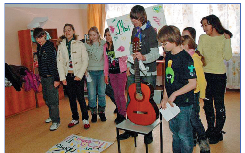
Штурм с гитарой

А вот и до митинга дело дошло! Этот митинг не по случаю требования добавки к обеду, а серьезное выступление против ученых. Они ущемляли права людей, которые обладали особыми способностями. Такими, как гипноз, телекинез, дар предвидения.