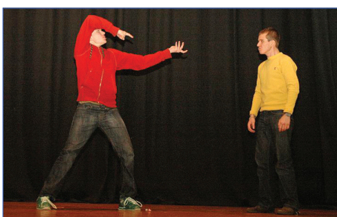
В любом месте веселее вместе!

Показ БТД отряда организаторов «Детский разум». Записывали шутки на протяжении всей ролевой игры, из этих же шуток и сложилось представление. БТД у всех отрядов были удивительно театральными и смешными. Спасибо за это огромное!