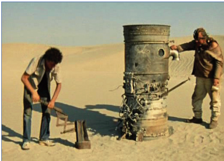
Как должно было быть

Многие игры РС основываются на различных фильмах или книгах, и эта игра – не исключение. Фильм «Кин-Дза-Дза!» Георгия Данелии, я думаю, видели многие. Трудно в точности назвать жанр этого фильма, но можно назвать его так: научно-фантастическая философско-сатирическая