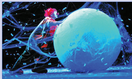
Шоу Славы Полунина

Газета основана в 1997 году Печатный орган детской организации «Остров Сокровищ» Гимназия № 45