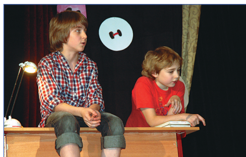
Окно и лошадь