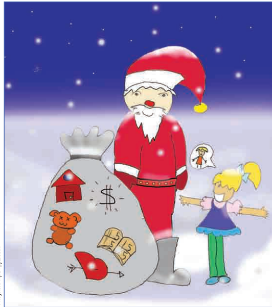
Рисунок: Ира Грушевая