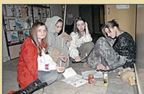
Персонажи плетут заговор

Вы хотите посмотреть фотографии последних школьных событий?