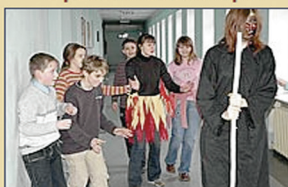
Охота на "Черного"