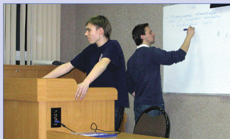
Большой конгресс Острова 3