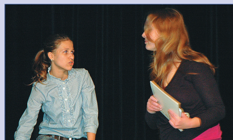
Театральный фестиваль 2

Газета основана в 1997 году Печатный орган детской организации «Остров Сокровищ» Гимназия № 45