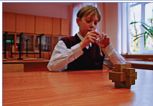
Будущий великий конструктор

На станциях «Спички» ребята решали задачи, известные еще с дедовских времен, но не потерявшие своей привлекательности до наших дней. Эти головоломки удобны своей портативностью, но требуют от решающего их усидчивости и упорства.