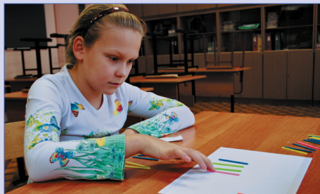
Интеллектуальная ярмарка 3