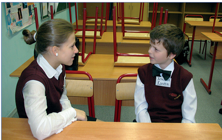
Разговор по душам

Другие издания вы сможете найти сами – тем более, что теперь на портале школьной прессы (portal.lgo.ru) можно подписываться на газеты, которые вам нравятся больше всего. Для этого достаточно просто зарегистрироваться на Портале и в своем досье отметить те издания, на которые вы хотели бы подписаться. Приятного чтения!