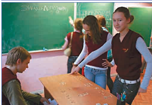
Без шпаргалки – никуда

Вы любите решать разные головоломки, сложные задачи, лабиринты? В эту субботу вам представилась такая возможность на Интеллектуальной ярмарке. Ребята посетили несколько станций, которые были организованы 8–10 классами. Например, в субботу участники могли поделаться лабиринты, головоломки, логические задачи, спички, слова, sudoku (японский сканворд). Выполняя задания, участники получали островки – деньги, с помощью которых они могли покупать в магазине призы. В конце мероприятия состоялся долгожданный аукцион, где ученики устраивали торги и, опять же, выигрывали подарки. Но как именно проходила Интеллектуальная ярмарка? Сейчас вы все сможете узнать!