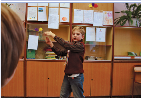
Пantomима – язык жестов

Не так-то легко передать слово, не произнося не звука, а только жестикулируя. На станции «Шарады» от участников требовалось проявлять максимальную сообразительность и смекалку. Ну а если тебя долго не понимают, непроизвольно начинаешь злиться.