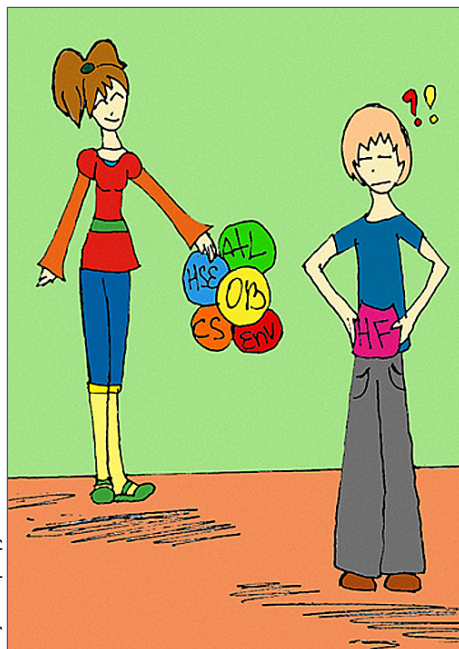
Рисунок: Мира Грушевая

почему же ромашка? Просто число областей соответствует количеству лепестков цветка, а если поставить свою работу или себя в центр, то получится, что все области взаимодействия тебя окружают, как и в жизни.