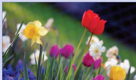
С началом весны и с 8 марта!