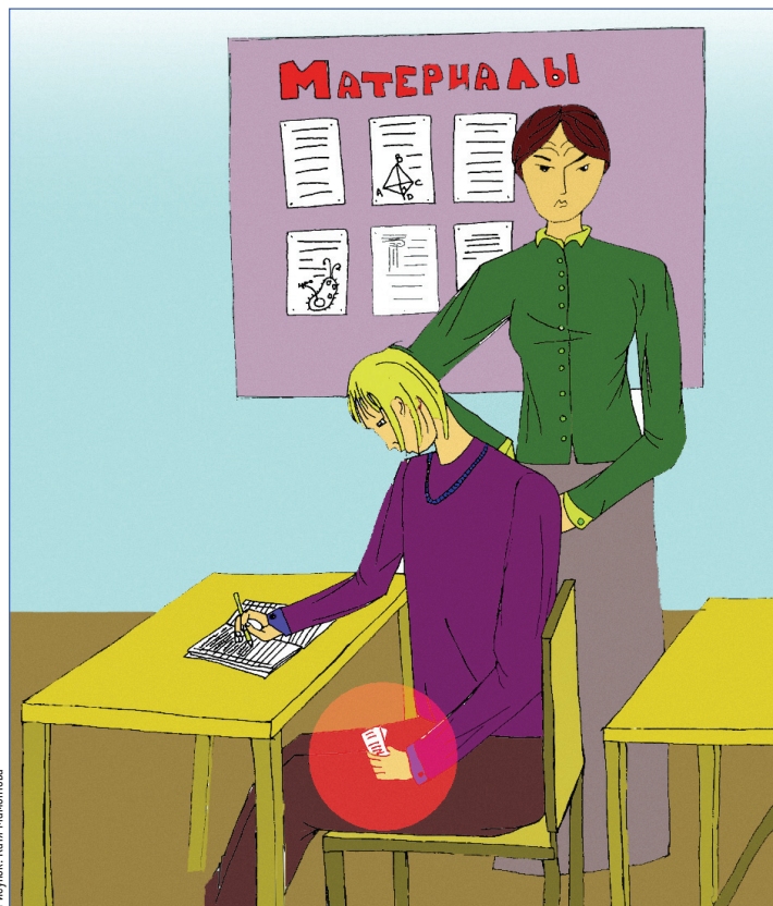
Рисунок: Катя Мамонтова

Больше настраивает на нечестное написание проверочных работ отношение к ним самих учителей. Ими часто пугают, к ним готовят, как к казни или порке, и говорят все время: «Ну, посмотрим, кто посмеется на контроль-