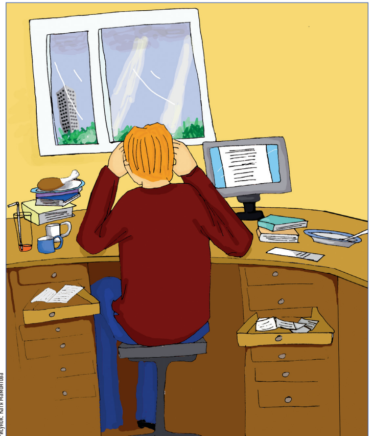
Рисунок: Катя Мажонтова

Важно помнить, что, будучи экстерном, вы не кукуете дома днями напролет. Существуют школы, в которых каждого ученика готовят по индивидуальной программе. Некоторые из них согласовывают расписание занятий с расписанием подготовительных курсов вузов, поэтому учащиеся школ-экстернатов имеют возможность обучаться одним составом в двух учебных заве-