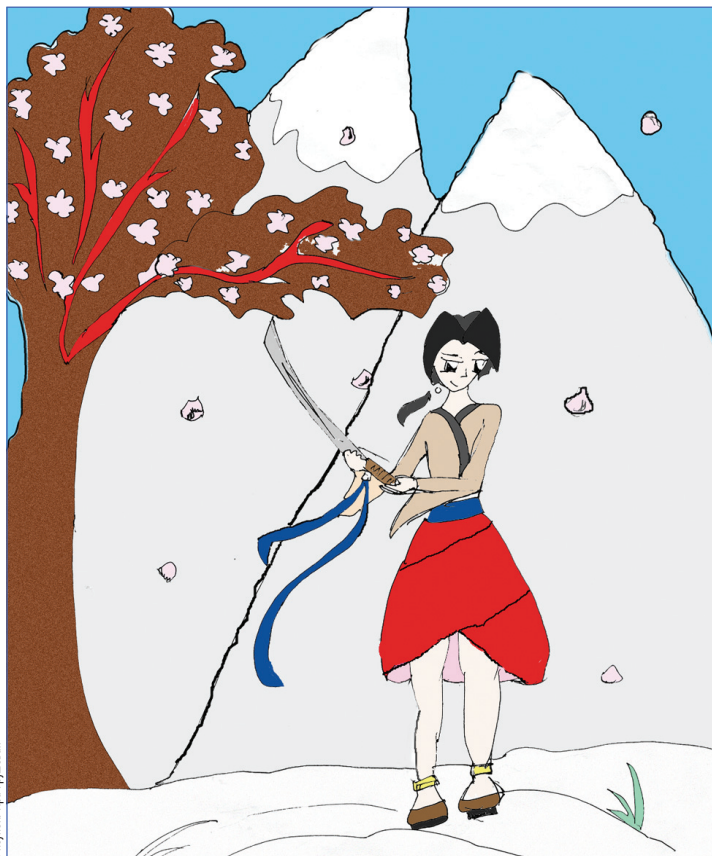
Рисунок: Ира Грушевая

«Насколько же он изменился! Настоящий юноша: высокий, статный, задорный и уверенный в се-