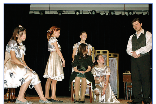
Привидения с папой