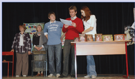
Театральный фестиваль 2 ▶

Газета основана в 1997 году Печатный орган детской организации «Остров Сокровищ» Гимназия № 45