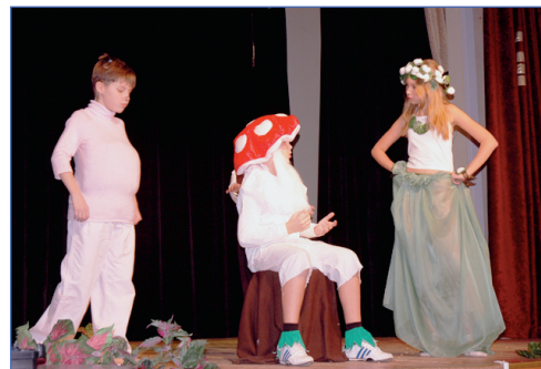
Волчья ягода с заданием справилась