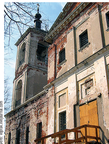
Старинный город Верея

В Брянске, после прохождения медицинской комиссии, у дедушки обнаружили плохое здоровье, непригодное для прохождения службы, и его направили в Москву в ВСУ-1 Комитета обороны, где он проработал до июня 1947 года. Началась мирная жизнь. И через много-много лет появилась я.