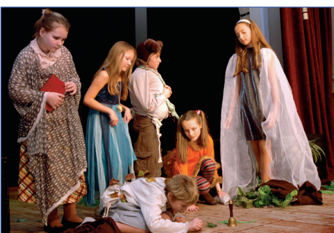
Что это он там нашел?

Монтеки и Капулетти. Болотницы и жители солнечной поляны. Чувствуете? Одна из болотниц родилась неправильного цвета, и старшая злобная сестра Трясина посадила ее в мешок, но храбрый Медведь спасает ее и приводит на свою поляну. Она встречает свою любовь – Лешачка. Пьеса была наполнена всевозможными чувствами.