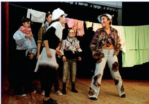
Мякам слово не давали!