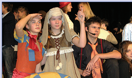
Десятилетие театра Острова