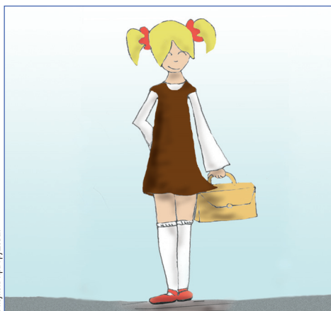
Рисунок: Ира Грушевая

Какими же были родители в 5–8-х классах? Пионеры в красных галстуках смотрят с фотографий тех лет. Это начало 80-х годов, время