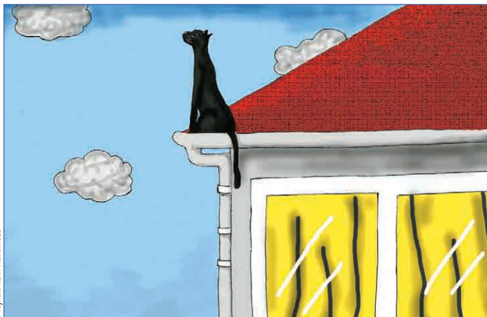
Рисунок: Катя Мамонтова

Кто знает, о чем думала кошка? Наверное, она мечтала о сметане, или о рыбе, или о крабовых палочках. Нет, скорее, думала о доме, который навсегда покинула еще маленьким котенком. О звуке разбивающихся капель, который раздается тогда, когда она обычно сидит под узким карнизом и наблюдает, как плачет серое небо. Или она думала о коте, таком же черном, с длинным хвостом и ярко-зелеными глазами. Наверное, этот