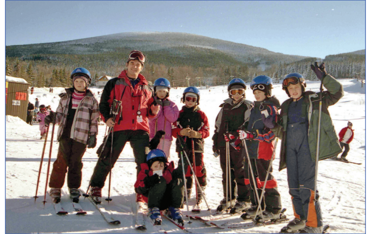
Лыжи – одно из лучших изобретений человечества!

Поучиться/покататься удавалось всего лишь еще два раза за оставшиеся дни. Все понимали, что возможности надо использовать по максимуму. И ребята, и инструктора. В сложных условиях, при дефиците времени свершили почти что невозможное. Все новички «поехали». И поехали уверенно. Да и «продолжающие» усовершенствовали свою технику. В том числе и за счет непривычно тяжелых условий. «Тяжело в учении – легко в бою!»