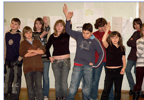
Рука = мнению

После БТД был диспут, на котором обсуждались разнообразные вопросы о традициях и их значимости. О связи между стереотипами и традициями. Рождают ли традиции стереотипы и наоборот. Что считать культурой? Мода – это культура? Тормозит ли наличие традиций развитие культуры? Все высказывались много и с удовольствием.