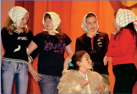
Отряд «Кот в мешке»

Важнейшее событие – представление отрядов. Новые составы, новые инструктора и, конечно же, названия отрядов. «Кот в мешке», отряд, от которого нельзя ждать чего-то определенного. «Мысля», отряд генераторов идей. «Полтора века», точнее 168 лет – сумма возрастов людей из отряда. «Гипотенуза – не катет», веселое название – веселый отряд.