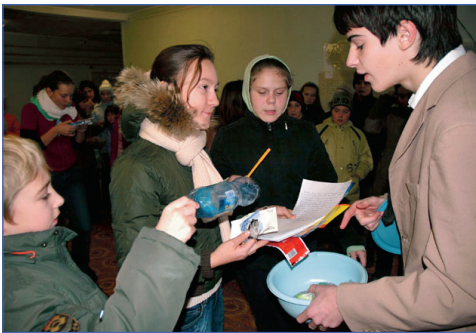
...предметы помещают в капсулу