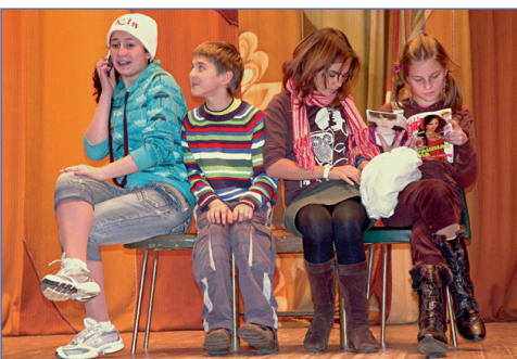
Кто же из них пройдет кастинг?