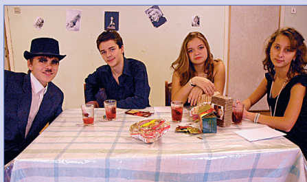
Осенний сбор в Пушкино

Газета основана в 1997 году Печатный орган детской организации «Остров Сокровищ» Гимназия №45