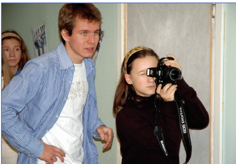
Внимание, сейчас вылетит птичка!

На сбор к нам прибыли звезды, которые, естественно, очень любят фотографироваться, например на обложки журналов. Кому же не нравится получаться на фотографиях красиво и качественно? Для того, чтобы угодить нашим гостям, некоторые люди от каждого отряда пошли на учебу к Андрею Кипяткову, учились, как надо фотографировать.