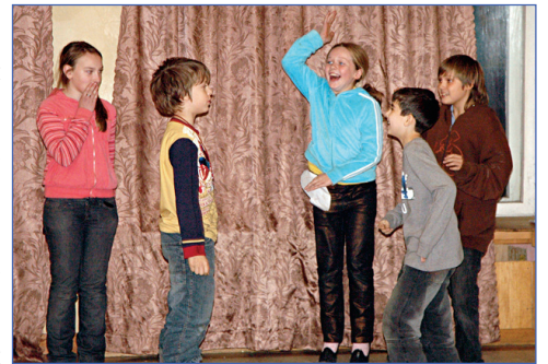
По традиции приходит Дед Мороз

Плюсы и минусы традиций? Вас мучает вопрос: соблюдать традиции или нет? Так знайте же, что однозначного ответа на этот вопрос нет. Это вам сможет подтвердить каждый, кто участвовал в Дне традиций. БТД отрядов продемонстрировало нам разнообразные ситуации, основная идея которых была практически одинаковой.