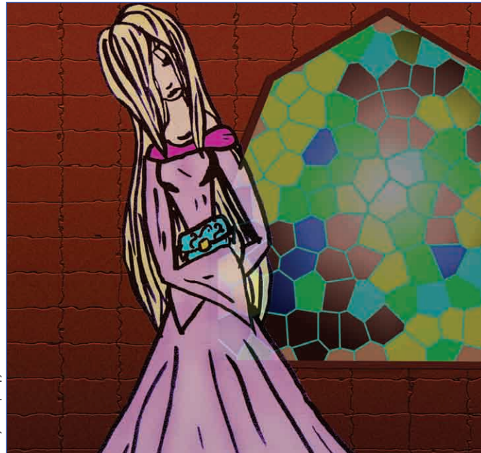
Рисунок: Ира Грушевая

Тим направился в дом Эдвардцев. Не прошло и трех минут, как он уже стоял на пороге дома. Он осторожно, на цыпочках стал подниматься по старой скрипучей деревянной лестнице. Тим вошел в дом. Все казалось ему серым. Пахло сыростью и безлюдьем. Он ступал осторожно по дому и тут наткнулся на что-то очень твердое и выпуклое. Мальчик нагнулся, посмотрел внимательно и увидел старинную пыльную шкатулку. Тим дул с нее пыль и взгляделся. На крышке увидел надпись: «Волшебная шкатулка мистера Эдвардца». Вдруг Тим ощутил что-то холодное и тяжелое на правом плече. Он оглянулся и увидел полупрозрачную мерцающую руку. Мальчик вздрогнул, закричал от неожиданности и схватив шкатулку, бросился бежать со всех ног. Внезапно он споткнулся и упал. Шкатулка выскользнула из его рук и со звоном ударилась об пол. Но вдруг Тим увидел нечто необъяснимое: перед ним дрожал силуэт девушки с белыми волосами. Удивительно то, что она была, как белый ангел, как воздух, как привидение. В белом платье и в белых туфельках. Она была прекрасна. Девушка осторожно подняла шкатулку и присела на корточки. Мальчик опять испугался и вскрикнул, но не двинулся с места. Девушка закрыла ему рот ладонью и шепнула на ухо: