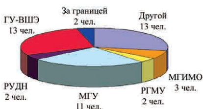
Выпуск-07: Распределение по ВУЗам

Увлекательно будет проследить пятилетнюю динамику в этой области. Возможно, еще более интересным является выбор профессии после окончания института... Но не стоит заглядывать далеко вперед. В смысле, в будущее.