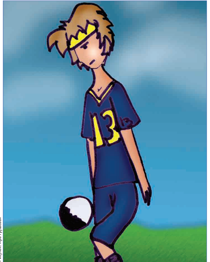
Рисунок: Ира Грушева

Итак, игра проходила в рваном темпе. Была жесткая мужская борьба без особо опасных моментов, что давало нам шанс держать игру под своим контролем. Но пару раз соперники действительно