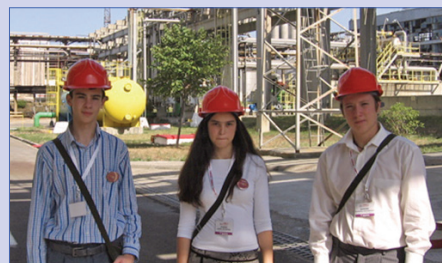
Каждому по каске