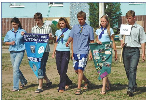
Маршируем перед корпусом

И вот самый торжественный момент в последний день лагеря. С каждым годом появляются новые люди, новые поколения. Каждое поколение показывает представление и что происходило в их год. Во время выступлений, приготовленных за пять минут, можно было и вдоволь посмеяться, и даже увидеть то, что никак не мог ожидать.