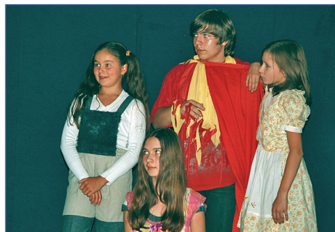
Маски, но не лица

В этот раз был довольно необычный Театральный Фестиваль. Отряды ставили не спектакли, а композиции. Многие даже проследились. В последний день, когда все отряды показывали свои выступления, из каждого уголка клуба были слышны всхлипывания, потому что все композиции были настолько трогательными, что пробирали до глубины души.