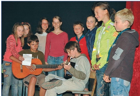
Поем, вспоминая лагерь

Отряды «Active people» и «После сна» показали несколько сценок о жизни лагеря и в конце спели очень трогательную песню. «Дети солнца», «Диполь» и «Wi-Fi» выступили просто отлично. Хорошо, что всем раздали дни, иначе что-нибудь точно повторилось. Все отряды выступили оригинально и оставили множество положительных впечатлений.