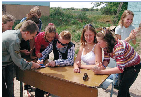
А потом автографы – в рамку!

Колумбия Пикчерз представляет... Нет, ничего она не представляет. Пробовали снимать трейлер к фильму? Нет? А вот мы – да. Затем мы попробовали разные дела, например, раздать автографы или провести ток-шоу. Я понимаю, что многим, кто не был в ЛТО, кажется странно, что в стенах лагеря возможно снять трейлер к фильму, но вы все-таки поверьте.