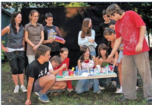
Город на ладони

С чем у вас ассоциируется словосочетание «День Городов»? Не знаю как у вас, но лично у меня и, наверное, у многих, кто был в ЛТО, с одним из дней в лагере. Каждый из отрядов строил свой мини-макет городов, а потом представлял на всеобщее обозрение. Многие оценили здания совершенно нового типа, придуманные отрядами.