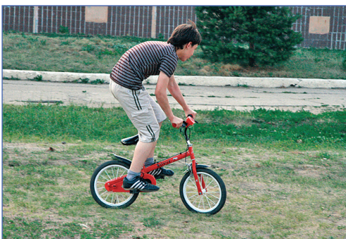
Железный конь и его всадник

Почти каждый день проводились спортчасы. В течение часа каждый мог поиграть в футбол (казалось даже, что некоторые поехали в лагерь только из-за него), волейбол, баскетбол, бадминтон, фрисби, поскакать на прыгалках или покрутить обруч. Так что все уехали в отличной форме и с красивыми фигурами.