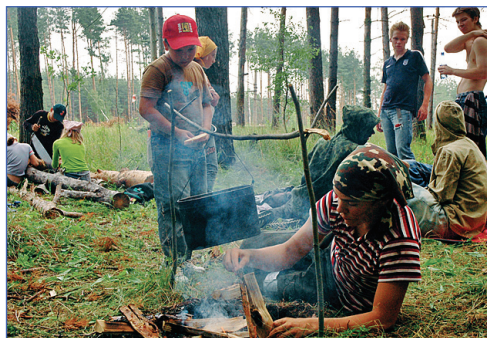
В лесу все вкуснее

Долгий, но веселый день выдался. До вечера бегаешь в лесу, станции проходишь. Да, не все так легко, но от этой «прогулки» зависит, сдашь ли ты ЗОК или нет. Конечно, многим пришлось туго. На мой взгляд, самой забавной и спокойной была станция «Песня». Дождь, который пошел под конец, нам совсем не помешал.