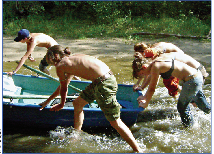
Кое-где было так мелко, что лодки приходилось толкать