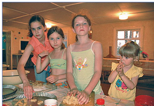
Вот такие пироги

Как насчет того, чтобы поработать собственными руками? Согласны? Цветочки посадить, зеркала поукрашать, флаги пошить, табуретки собирать, повязывать таблички? Как насчет того, чтобы делать все это дома? Скучно одним работать? Так поехали в ЛТО, там вам будет и компания, и работа, и много новых впечатлений.