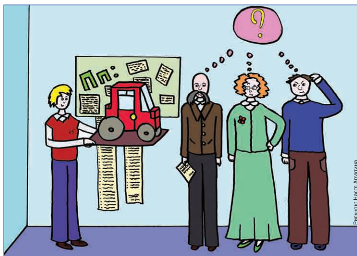
«Не совсем понятно: чему вы научились в процессе работы?»

И даже, в общем-то, неважно, что иногда проектная работа доводилась до абсурдности, и отчет о работе, бывало, отнимал на порядок больше времени и сил, чем сама по себе работа – это можно простить только начавшему развиваться методу. Некоторые работы были даже довольно-таки интересными и запоминающимися. Например, моей параллели в свое время повезло столкнуться с заданием по созданию одного выпуска собственного журнала – даже с распределением должностей, все как положено: главный