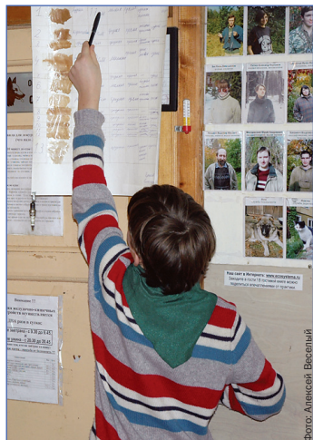
Защита «лесной домашки»

Многие ребята с удовольствием ездят на биостанцию как раз именно из-за такой интересной учебы. А для особо желающих поездка проводится еще и в мае. Весной занятия становятся еще более насыщенными, ведь прекрасная погода, красивые места и свежий воздух — это уже не учеба, а настоящий отдых.