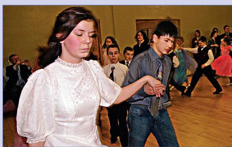
Все на бал