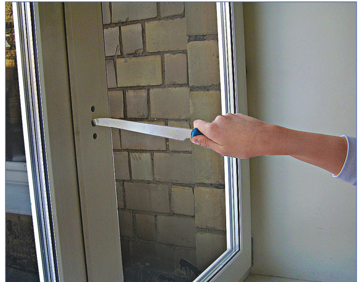
Когда желание свободы затмевает разум...

Любое образование строится на ступенчатом развитии, при котором в начале пути ученик постигает те знания, которые сами по себе представляют малую ценность, однако без них невозможно дальнейшее обучение. Поэтому в начальной и средней школе мало кто понимает всю ценность получаемых знаний. Ученики постоянно недоумевают,