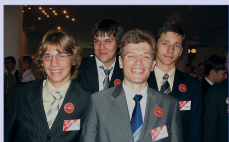
Поездка 45-й в Нижний Новгород 3

Печатный орган детской организации "Остров Сокровищ" Гимназия №45 Газета основана в 1997 году