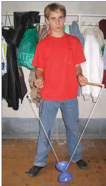
Я - «дьяболист»!

Ладно, будем надеяться, что скоро мы сможем коллекционировать собственных клонов - какой из них удачнее получился.