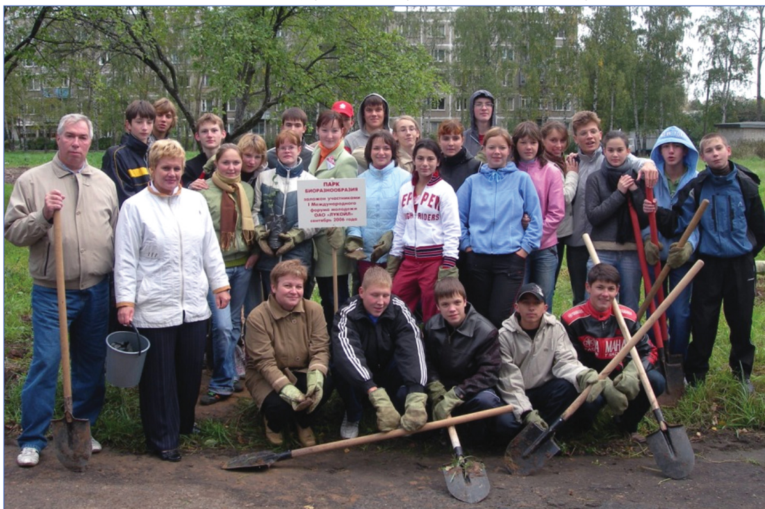
Парк биоразнообразия в Нижнем Новгороде не заложишь без лопаты, не правда ли?

На следующий день у нас была запланирована посадка деревьев. Мы приехали в ту же школу и там вместе с местными ребятами посадили около двух сотен «деревьев». На самом деле это был шиповник, но процесс от этого не перестал быть очень динамичным и занимательным. После этого нас напоили чаем (на улице холод стоял немощный). Мы еще раз пообщались с местными школьниками на различные темы, начиная от школьных проблем, заканчивая описанием времяпрепровождения. После этого мы опять отправились в «Академию», где посмотрели выступления тхэквондистов и самбистов. После этого желающие могли пройти мастер-класс по самбо. Наконец состоялась серия турниров.