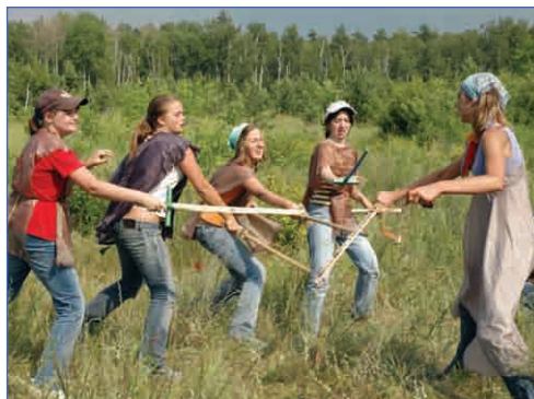
Убить с двух ударов

После двухчасовой прополки можно и талант открыть, и дверь закрыть! Недаром юным войскам по борьбе с сорняками сократили их битву с вражескими ротами моркови на 2 часа – все это делалось для того, чтобы, выступая на сцене, можно было выплеснуть сохраненную энергию на зрителя и показать все, на что мы способны!