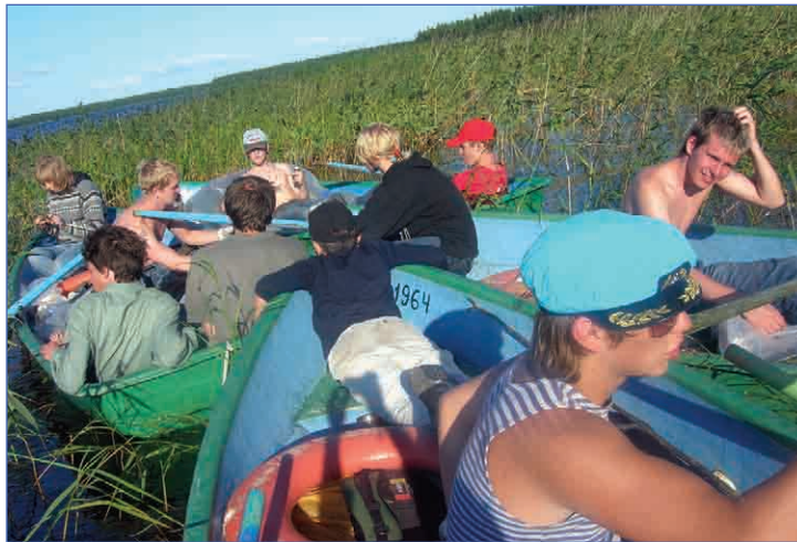
А вокруг – камыши... Степь да степь кругом.

Приехали, и большие мальчики сразу отпаривались за лодками. Прямо рядом с остановкой был песчаный пляж. Ну, многие, не раздумывая, тут и прошли водное крещение: переоделись в купальники и пошли плавать. Вода прохладная, но снаружи жарко,