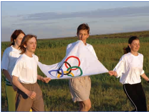
По 5 колец каждые 4 года