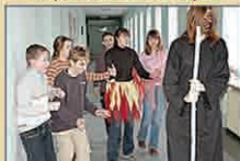
Охота на "черного"