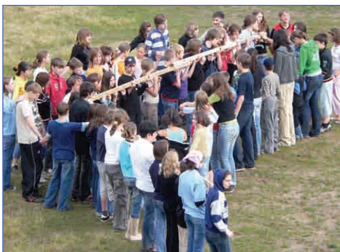
Рука, прием! На связи мозг

Эта толпа, на первый взгляд переносящих куда-то стройматериалы, уже потеряла человеческие качества. Взгляните на этих строителей внимательней – это же нервы и клетки мышц, работающие ради блага человека. И с чего вы решили, что смотрите на фотографию? Вы просто решили разглядеть собственную руку.