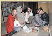
Персонажи летуг заговор