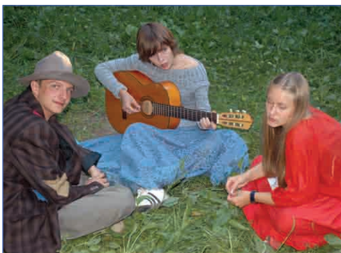
Гитара радуется всегда

Почему эти нищие певцы не могут дойти до метро и там просить милостыню? Потому что до московского метрополитена нужно идти девяносто километров, а им и здесь хорошо живется. Еще бы – в таком загадочном городе, где убийства мэров происходят с определенной периодичностью.