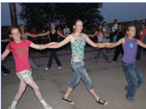
Они родом из Греции