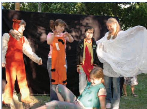
Лес под кулисой