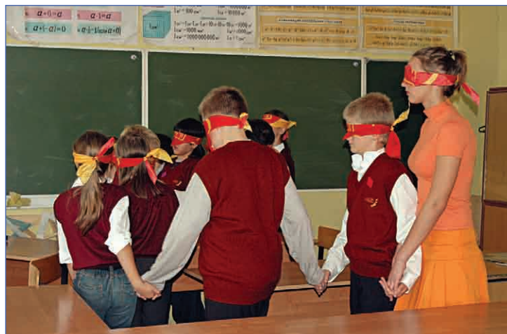
Мы не видим друг друга, но знаем