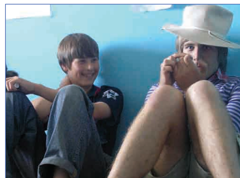
Я родом из стихов...