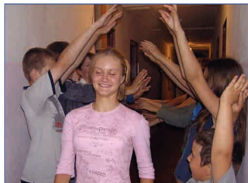
Руки вверх! Бежит инструктор!

«Ручеек вроде и не глубокий, а утонуть все равно страшно», – сказал бы инструктор, не доверяющий своему отряду. Или не умеющий плавать. Кто знает? Но в любом случае речь идет не о так улыбающемся человеке. Этот человек на 100 % уверен, что его отряд поднимет перед ним руки.