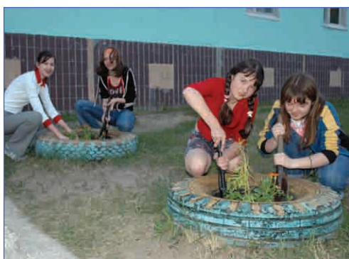
И лагерь превратим мы в сад...