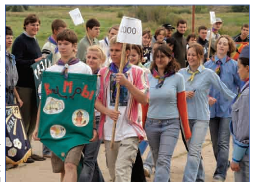
Годы шагают один за другим...

Простите, на страницах многотиражной лагерной газеты «Скрепка».