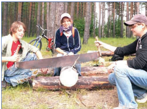
На себя не дверь, а пилу тяни!

Вы – электричка. Ехать часов 6. В багажном отделении у вас лежит обед. На маршруте 10-14 остановок. На каждой станции вам дают зеленый свет в случае выполнения задания дежурного по вокзалу. По окончании поездки пассажиры должны быть довольны путешествием – только в этом случае вы получите ЗОК по туризму.