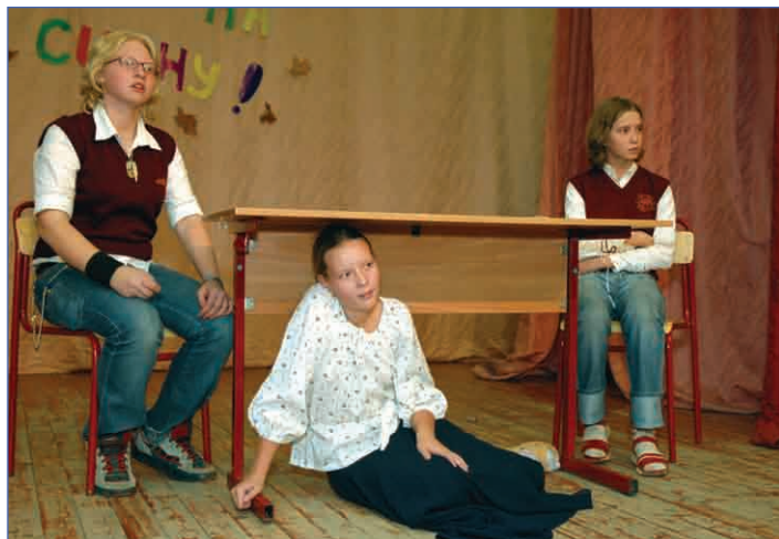
Не надо на нас рисовать! Сами мыть будете

А на самом деле, мне кажется, что все читатели могут сделать свой шаг на сцену. Вы можете маршировать, прыгать, бежать галопом, но я вам искренне советую за свою школьную жизнь успеть хотя бы забраться на сцену.