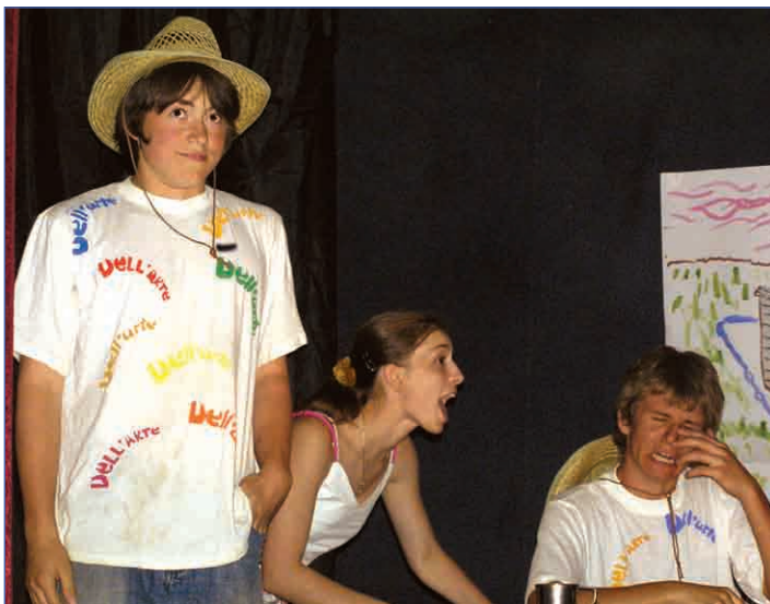
Мы в чем-то похожи...

В этой статье, исходя из ее названия, я должна оповестить вас о планах театрального отряда или же о предстоящих событиях (постановках) на школьной сцене, которые организует Остров. Но дело в том, что во время учебного года театрального отряда как такового не существует. Его состав постоянно меняется, в отличие от отряда журналистики или ролевого отряда Fauler. Есть, конечно же, личности, которые остаются верны только театральному делу, но таких немного. Обычно театральный отряд - это груп-