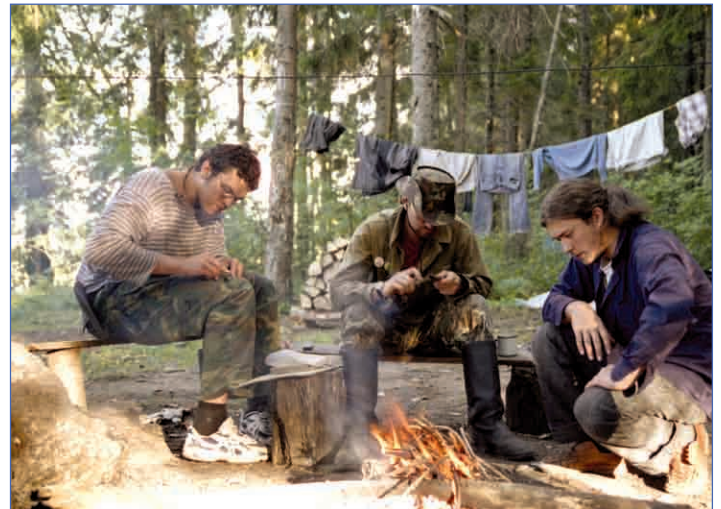
Три танкиста, три весёлых дру-у-га, экипаж машины боевой!

На утро переплыв к нашей первой стоянке (на Белом озере) был удачный, как, впрочем,