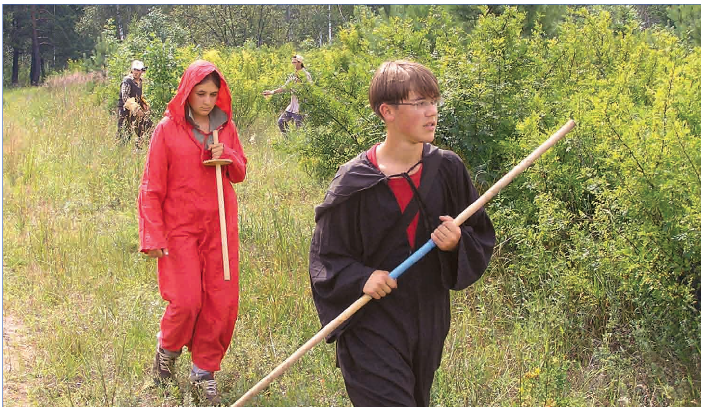
Я убью тебя, тролль...

Закончился трудовой лагерь, но он оставил в нашей памяти много ярких дней и мероприятий. О некоторых я и хочу вам здесь рассказать.