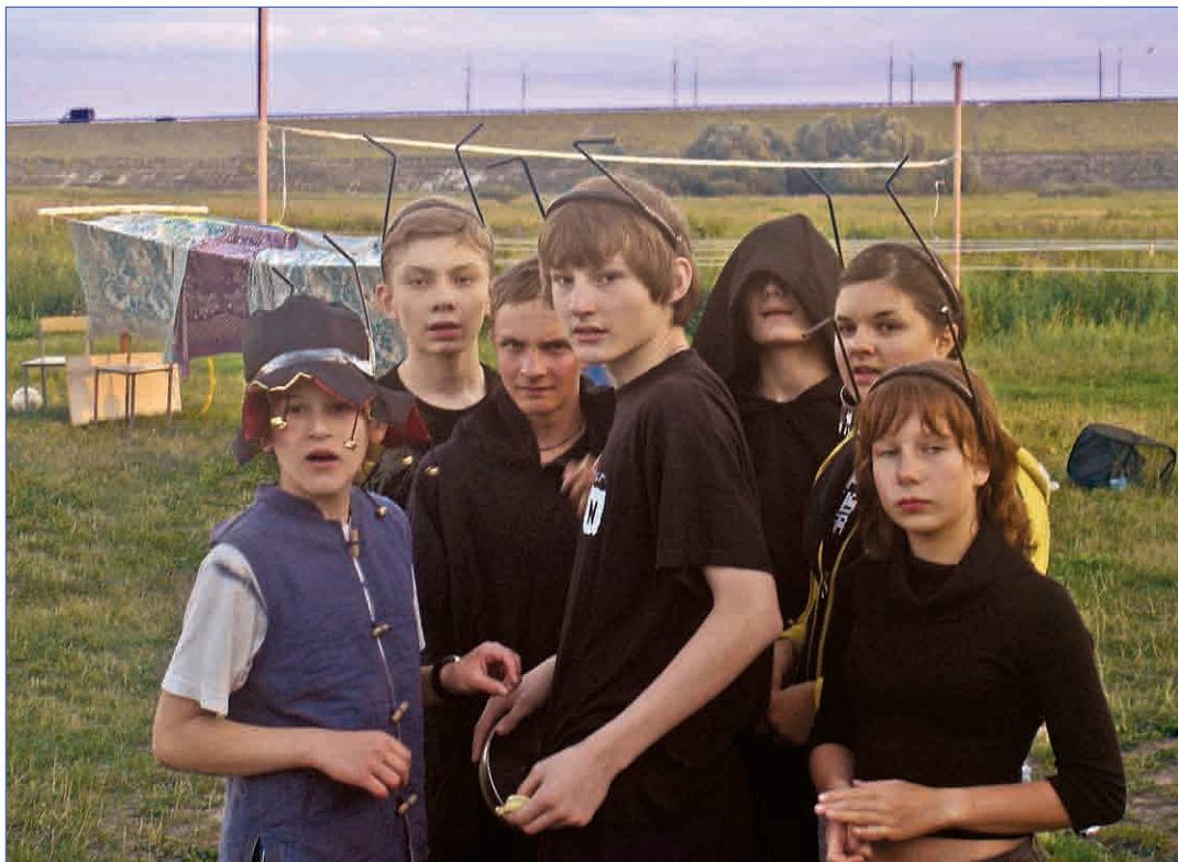
А чего это вы смотрите? Мы муравьи...