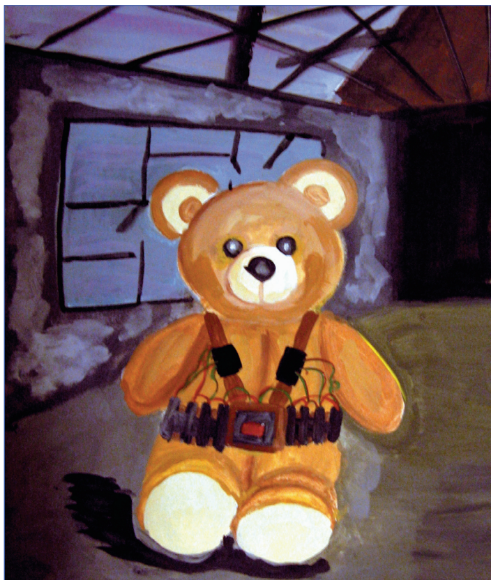
Автор рисунка: С. Самородова из б «А»

Звучит идеально, но напрашивается вполне ожидаемый вопрос: ЧТО делать? Если честно, я не знаю. Я не политик и официально даже не взрослая. Я всего лишь человек, возмущенный сложившейся ситуацией и, думаю, я не одна такая. Есть общая цель, так неужели это невозможно сделать так, как действительно хочется? Ведь самое страшное - бездействовать! Я не могу переложить всю вину на плечи террористов, это и моя вина - я тоже живу в мире, где могут запросто убить. По-моему, современные трагедии наводят ужас даже на самых бездушных людей. И я искренне верю, что когда-нибудь - не знаю когда - мы забудем о необъяснимой жестокости, в том числе о терроризме.