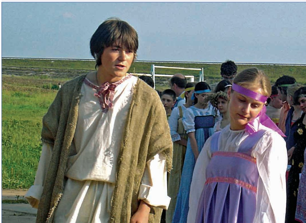
«Я люблю тебя, Снегурочка...»

В этих отрядах народ старше 8 класса, но опять же не все. Позволить себе такую «роскошь» (да, какая там роскошь?) могут лишь те, кто сдал два зачета по этому самому театру, журналистике, медицине и туризму. Некоторые люди, достигшие «профильного» возраста все равно отказываются и едут в обыкновенный отряд. Почему так происходит? Потому что многие не могут найти себе занятие по душе, многие не интересуются ни театром, ни журналистикой, ни ролевыми играми. Да и не в этом одном дело. Во-первых, если ты профильник, ты перед лагерем должен посещать разного рода собрания отряда. Во-вторых, предполагается твоя работа в этой выбранной сфере в течении учебного года. И тут человек задает себе вопрос: «А надо ли мне это?» - и с чистой совестью вновь отправляется в обычный отряд.