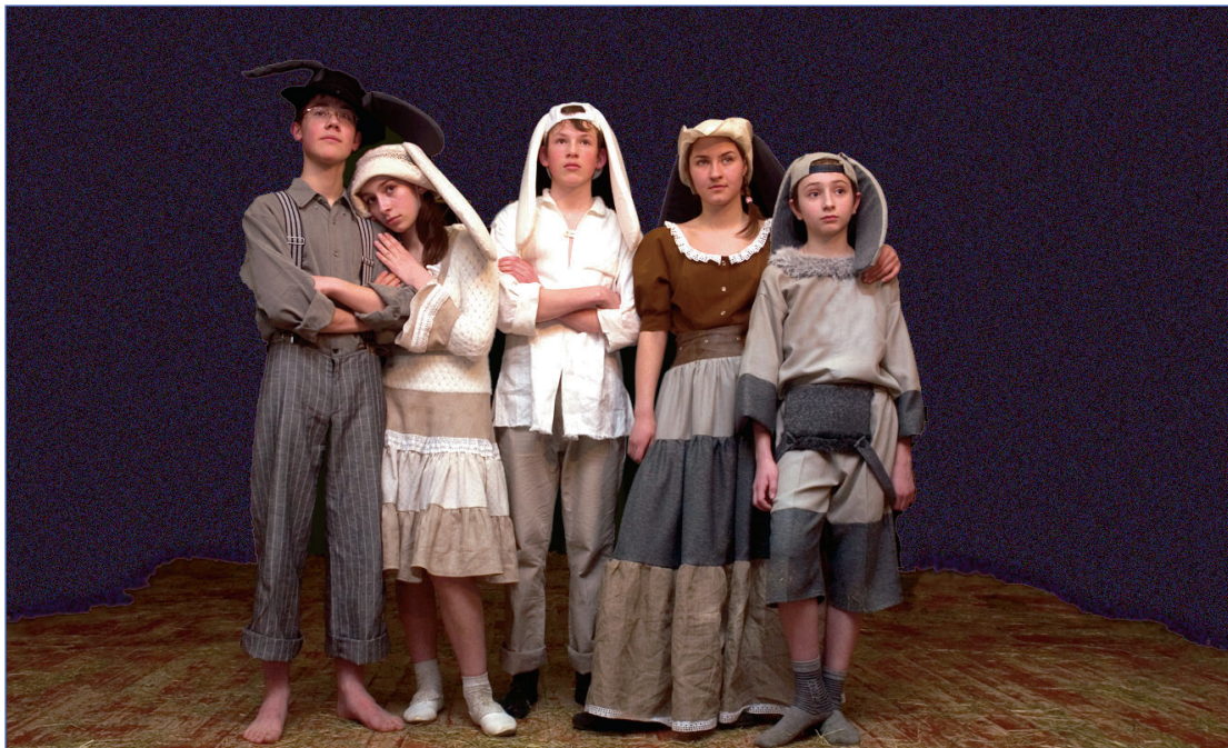
На сцене главные герои