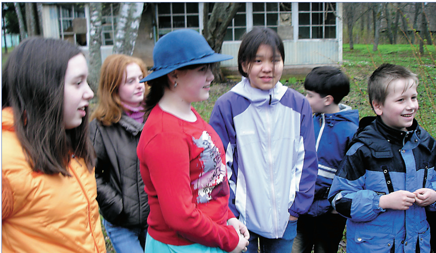
Представление отряда организаторов

Идем гуськом, на пятки не наступаем. Первые вы, последние не вы. Я впереди всех, ты последний. За билетами бежит Седов. Всё, тронулись. Ура. Не очень изысканно, в лучших традициях, просто и лаконично. Так все и началось. Стоп. Вру. Перенесемся ровно на месяц назад, эдак на вторую неделю апреля. Здесь находятся истоки реально значительного события в жизни многих несовершеннолетних людей нашей школы и, как минимум, одного из 518-ой. Речь о сборе (да я мог бы этого не говорить, большинству понятно, но все же).