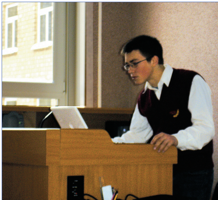
«Я все сделал очень хорошо... Поверьте.»

Первое. Совершенно необязательно при планировании проекта