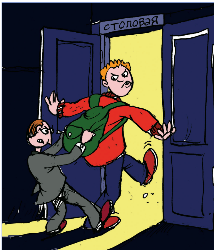
Разрешите выйти вон!

Всех людей, включая учителей нашей школы и родителей учеников, с давних пор беспокоит вопрос дисциплины в школе. Потому что каждый понимает, что дисциплина - всему голова, хорошая школа не может существовать без строгой дисциплины.