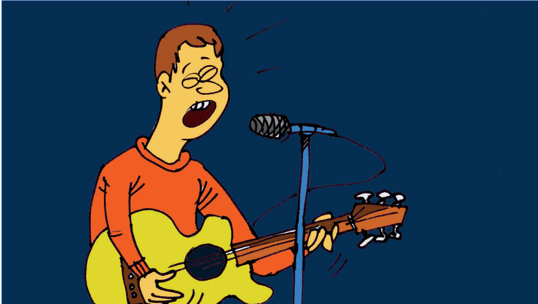
Изгиб гитары желтой...