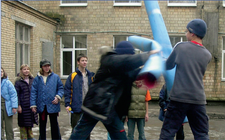
“Схватка на мосту”

Где-то на далеком острове в огромном Мировом океане стоит, века этак уже четыре, большой форт, который окружен каменными стенами, огромными скалами. На нем есть некоторое количество видеокамер, старикашка, запертый на башне, два карлика, бегающих за туристами с материка, и помещение, где сильно накурено, темно и стоят мужики в балахонах. Более того французы называли это место