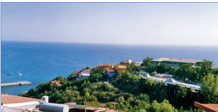
А неплохо бы Острову иметь базу тут...

Как вы думаете - является ли ОС школьной организацией?