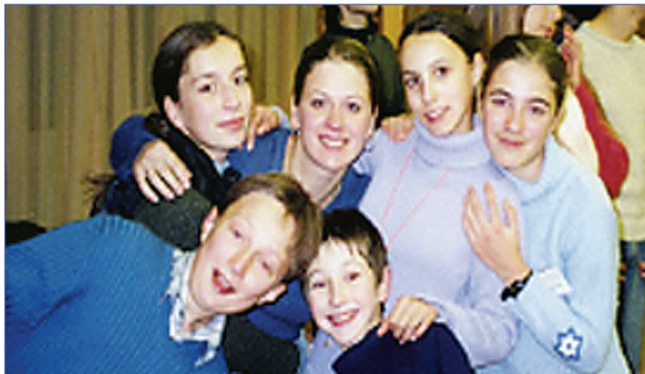
Мы - дружная семья!, АЮЛ

Поехали мы как-то отдыхать. Нет еще лучше. Поехали мы как-то отдыхать в детский оздоровительный лагерь Московию. Нет, намного лучше. Мы должны были пропустить целых три учебных дня. Желающих было - хоть отбавляй. Отдохнуть вместо учебы все хотят. Правда, как оказалось, потом отдохнуть там никому не удалось. Но обо всем по порядку. Сначала мне казалось, будто бы мы едем на какую нибудь мелкую конференцию, похожую на те, которые обычно проходят у нас в Улан-Батарежке. Посадили нас в какие-то автобусы, крайне похожие на те, в которых мы обычно ездим на поля работать. Повезли в какой-то лесок. В конце этой дороги, где то глубоко в лесу, был какой-то са-