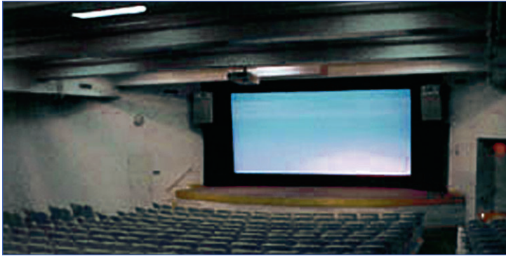
Перед началом сеанса

Знаете, чего я сейчас больше всего хочу? В кино попасть. Правда, абсолютно серьезно. Неважно что смотреть, важен сам факт. Потому, что в последний раз я была в кино месяца четыре назад. Это учитывая то, что в кино я обычно каждую неделю хожу. По выходным. А все от чего? Все вышеизложенное является лирическим отступлением и подводит к следующему: